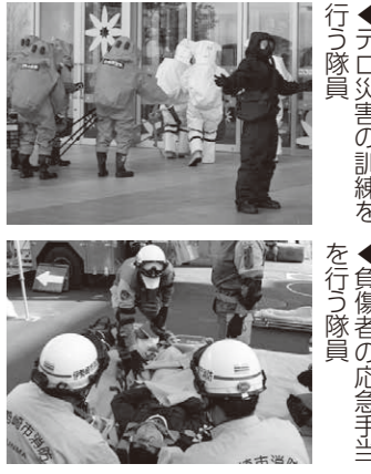
テロ災害の訓練を行う隊員 負傷者の応急手当を行う隊員

多くの市民が集まる行政庁舎を狙ったテロ行為などに備えて、市役所・消防本部・市消防団・県機動隊・伊勢崎警察・市民病院・伊勢崎佐波医師会病院が連携し、テロ災害への対応力の強化を目的とした訓練を実施します。 期日 3月2日(土) 時間 午前9時30分～11時30分 会場 市役所 ※来場の際は市役所南駐車場を利用してください。市役所北側2カ所の出入口は利用できません 問い合わせ 消防本部警防課 ☎(25)3916