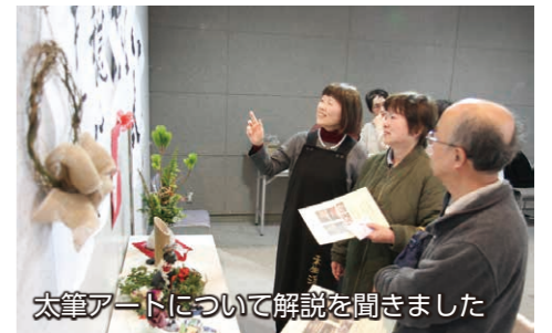
太筆アートについて解説を聞きました

1月19日、「生涯学習大会」が境総合文化センターを会場に開催されました。ロビーでは手芸・工芸作品などの展示のほか、太筆アートやバルーンアート、フラワーアレンジメントの体験コーナーなどが設けられ、来場した多くの方が展示や体験を楽しみました。ステージでは、各地区の市民グループや生涯学習支援ボランティア・まなびい先生が日頃の活動の成果を披露。ダンスや合唱、楽器演奏などさまざまな演目が披露され、観覧した人たちを楽しませました。