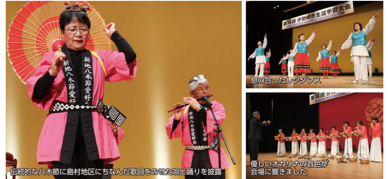
伝統的な八木節に島村地区にちなんだ歌詞をのせた唄と踊りを披露

1月19日、「生涯学習大会」が境総合文化センターを会場に開催されました。ロビーでは手芸・工芸作品などの展示のほか、太筆アートやバルーンアート、フラワーアレンジメントの体験コーナーなどが設けられ、来場した多くの方が展示や体験を楽しみました。ステージでは、各地区の市民グループや生涯学習支援ボランティア・まなびい先生が日頃の活動の成果を披露。ダンスや合唱、楽器演奏などさまざまな演目が披露され、観覧した人たちを楽しませました。