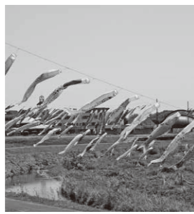
▲譲られたこいのぼりが大空を泳ぎます

催し 消費者行政講座 消費生活センター ☎273300 高齢者の消費者被害を、自分自身で防ぐ方法や地域で連