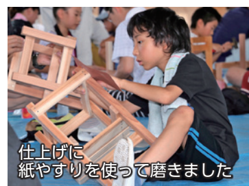
仕上げに紙やすりを使って磨きました

8月3日、赤堀体育館で「親子木工教室」が行われました。今回、製作に取り組んだのはイス。参加した親子は、設計図を見ながら金づちを使って協力して組み立てていました。作業中には群馬伊勢崎商工会建設部会の皆さんが、作業に戸惑う親子にくぎを真っすぐ打つ方法など、組み立てに当たったアドバイスをしていました。最後には紙やすりを使って仕上げをして、立派なイスを完成させました。