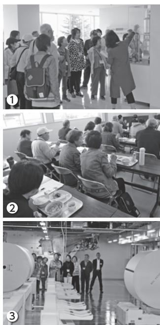
▲昨年度の市民施設見学会の様子/①清掃リサイクルセンター21/②第二学校給食調理場/③上毛新聞印刷センター

アクセス・メールで広報課へ ※1通で2人分まで申し込みができます。2人での参加の場合、2人の住所などをそれぞれ記入してください ※傷害保険加入の際に、住所氏名、年齢、電話番号を保険会社に提供します。承知した上で応募してください 宛先 〒372-18501 (住所不変) 市役所広報課 市民施設見学会係、☎(23)9800、✉kouhou@city.isesaki.lg.jp 締切日 10月3日(木) ※当日消印有効