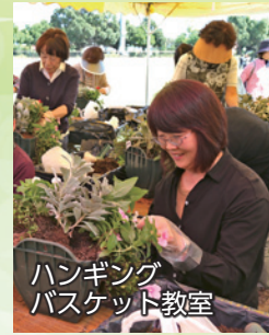
ハンギングバスケット教室