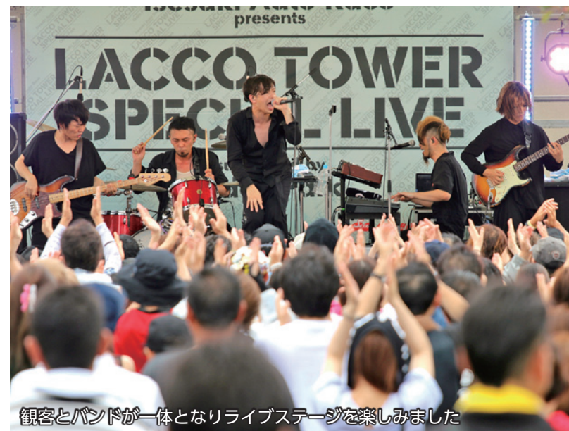
観客とバンドが一体となりライブステージを楽しみました