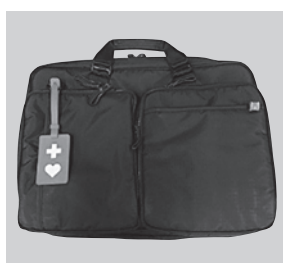
▲赤地に白色の十字とハートが描かれたヘルプマーク

一定の面積以上の土地取引を行った場合(市街化区域内で2000平方メートル以上、市街化区域以外の都市計画区域内で5000平方メートル以上)、土地購入者は契約日から2週間以内に都市計画課に届け出をする必要があります。忘れずに届け出をしてください。