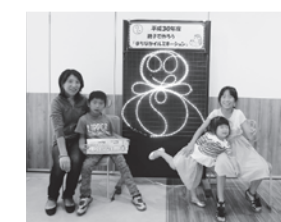
▲親子で制作したイルミネーションが伊勢崎駅前を彩ります

ロケットライトを使って、キャラクターや動物などのオリジナル作品を制作します。完成作品は「作品のタイトル」と「制作者名」などを添えて、展示します 参加料 無料 ※作品は返却しません 申し込み 9月23日(祝)午前9時から10月14日(祝)午後5時まで直接または電話で伊勢崎駅前インフォメーションセンター(☎6180008)へ ※点灯式への参加希望を申し込みの際に確認します。定員は2組(先着順)です ※月曜日は休館です。9月23日(祝)と10月14日(祝)は開館し、9月24日(火)は休館します