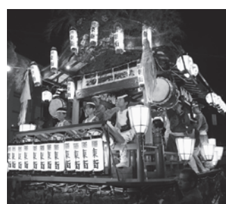
▲改修した屋台で境ふるさとまつりに参加しました

市町村振興宝くじを財源とする「魅力あるコミュニティ助成事業」を利用して、境東町区では祭り用の屋台を改修しました。地域交流のさらなる活性化が期待されます。