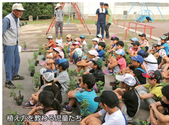
植え方を教わる児童たち