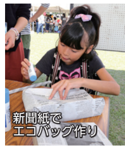
新聞紙でエコバッグ作り