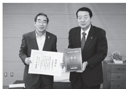
▲佐波伊勢崎農業協同組合に感謝状と表示証を送りました