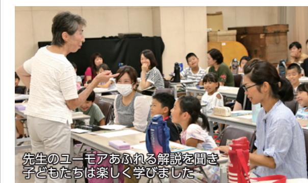
先生のユーモアあふれる解説を聞き子どもたちは楽しく学びました

7月27日・28日、市内の各図書館で「読書感想文の書き方講座」が行われました。講座では、本の選び方や文の組み立て方など、より良い読書感想文にするためのコツを先生が子どもたちに楽しく解説。子どもたちは解説を聞いてメモしたり、先生からの質問に元よく挙手して答えたりと、楽しみながら読書感想文の書き方を学びました。