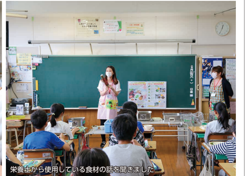
栄養士から使用している食材の話をお聞きしました