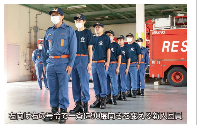
右向け右の号令で一斉に90度向きを変える新入団員

7月19日、伊勢崎消防署で市消防団の第1・2方面隊の新入団員を対象とした教養訓練と水防訓練が行われました。両方面隊の新入団員、合わせて14人が訓練に参加。消防団活動の基本動作となる整列や敬礼、駆け足などの行進の訓練に取り組みました。その後の水防訓練では、真剣な表情で土のう作成の習得に励んでいました。