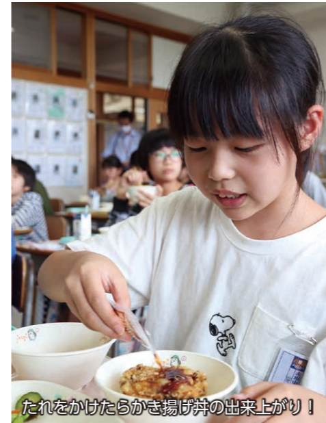
たれをかけたらかき揚げ丼の出来上がり!