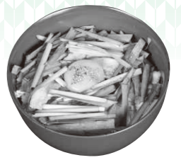
▲伊勢崎産のニラを使った「雷井」

伊勢崎市が「全国屈指のニラ産地」であることを市民の皆さんに広く知ってもらうために、「地産地消推進の店」登録飲食店が協力して、伊勢崎産のニラを使った「雷井」などの各店オリジナルの料理を提供します。テイクアウトやデリバリー対応を行っている店舗もあります。参加店は、市ホームページで確認できます。 期間 8月22日(土)から9月13日(日)まで 問い合わせ 農政課(☎27-2757)