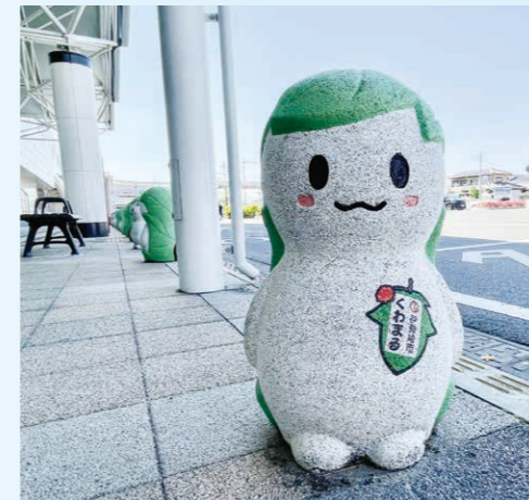
撮影場所：伊勢崎駅

市広報課公式インスタグラムで「#いち推し伊勢崎」を付けて投稿された皆さんの写真を紹介しています。