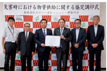
▲協定を締結した会社の代表者と臂市長

物資(ウレタン製品)の供給を行うことを目的として、(有)スワコーポレーションと協定を締結しました。