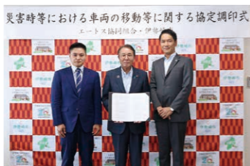
▲協定を締結した組合の代表者と臂市長