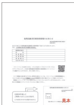
▲資格情報のお知らせはA4サイズです