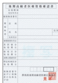
▲資格確認書は従来の保険証と同じサイズです