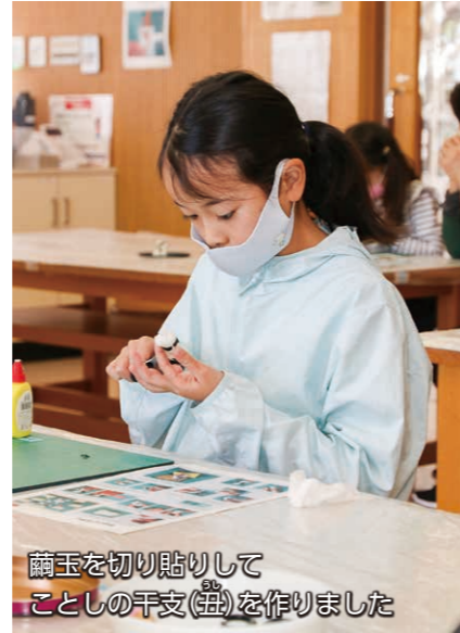
繭玉を切り貼りして ことしの干支(丑)を作りました