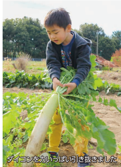
ダイコンをいっぱい引き抜きました