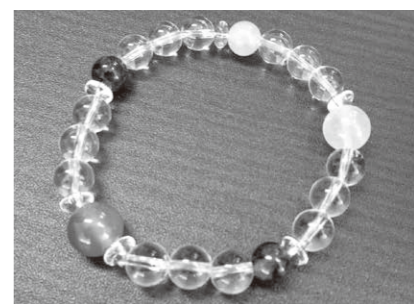
▲オリジナルブレスレットを作りますか