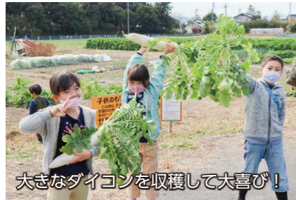
大きなダイコンを収穫して大喜び！