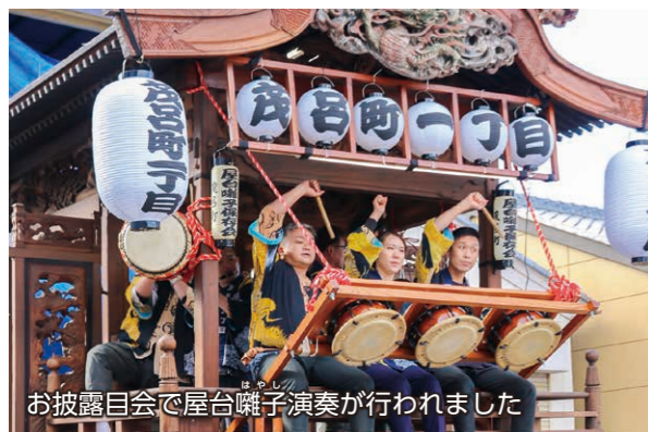
お披露目会で屋台囃子演奏が行われました

10月25日・31日・11月8日・15日・29日、修復した茂呂地区の屋台5基のお披露目会として、各町内で屋台囃子演奏が行われました。茂呂地区の屋台は幕末期から明治期に製作された物で、市指定重要有形民俗文化財に指定されています。屋台は破損した部分の補修やゆがみの補正がされ、製作当初の姿によみがえりました。