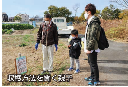
収穫方法を聞く親子