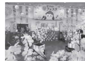
▲前回の展示の様子