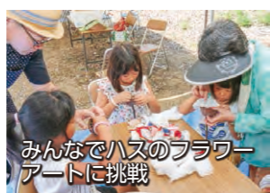
みんなでハスのフラワー アートに挑戦

イベント会場では、ハスのドライフラワーを使ったフラワーアート教室やかき氷・赤飯などの配布も行われ、会場はにぎわいを見せていました。