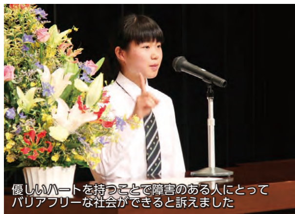
優しいハートを持つことで障害のある人にとって バリアフリーな社会ができると訴えました