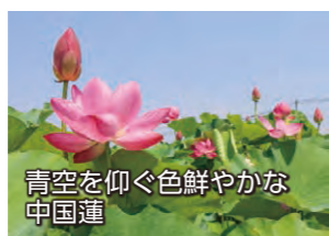
青空を仰ぐ色鮮やかな 中国蓮