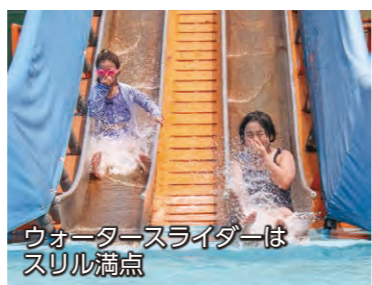
ウォータースライダーは スリル満点

7月14日、市民プール・境プール・あずまウォーターランドの屋外プールがオープンしました。21日、市内の小・中学校が夏休みに入ったことで、市民プールは本格的なにぎわいを見せ始めました。日が照り付けるこの日は、子どもたちが浮輪を使って遊んだり、友達と一緒にウォータースライダーを楽しんだりしていました。家族での来場者も多く、家族一緒に屋外プールを楽しみ、夏の良い思い出作りとなりました。