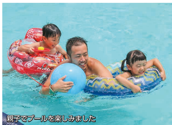
親子でプールを楽しみました