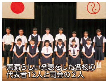
素晴らしい発表をした各校の 代表者12人と司会の2人

6月30日、境総合文化センターで「少年の主張 伊勢崎市大会」が行われました。市内の各中学校と四ツ葉学園中等教育学校の代表者12人が、人種や文化、宗教の違いを認め合える社会をつくることの大切さなど、普段の生活の中で感じた思いを発表。大会では境南中学校吹奏楽部によるミニコンサートも行われ会場を盛り上げました。