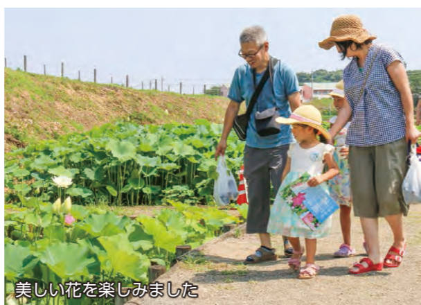
美しい花を楽しみました