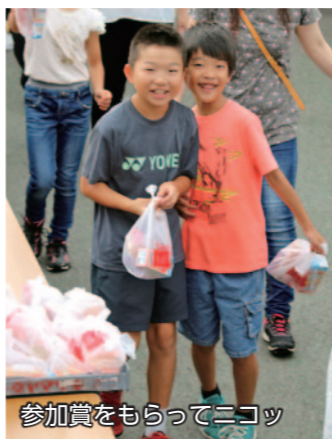
参加賞をもらってニコッ