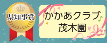
かかあクラブ 茂木園