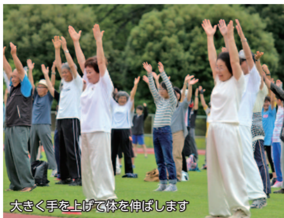
大きく手を上げて体を伸ばします

7月21日、市陸上競技場と境総合運動場で「夏季ラジオ体操会」が開催されました。両会場には早朝から多くの親子や小・中学生など、合計で623人が集まりました。午前6時30分にラジオ体操の音楽が会場に流れると、参加者は一斉に、元気に体を動かしました。ラジオ体操終了後は、参加賞のパンとドリンクが配られ、参加賞を手にして喜び子どもたちの笑顔が見られました。