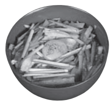
▲伊勢崎市産のニラを使った「雷井」

伊勢崎市が「全国屈指のニラ産地」であることを市民の皆さんに広く知ってもらうために、「地産地消推進の店」登録飲食店の協力により、伊勢崎市の各店オリジナルの料理を提供します。参加店は、市ホームページに掲載します。