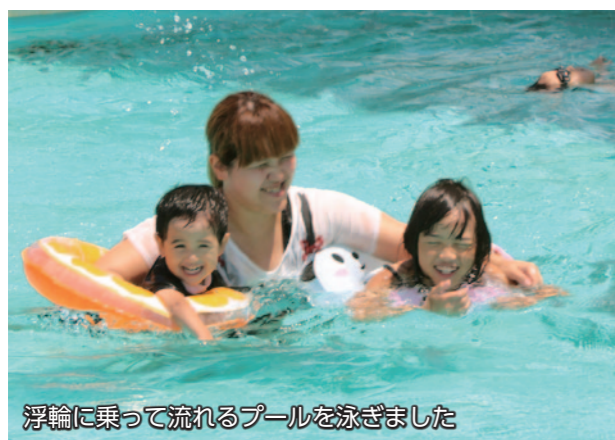
浮輪に乗って流れるプールを泳ぎました