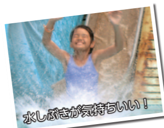
水しぶきが気持ちいい!

7月13日、市民プール・境プール・あずまウォーターランドの屋外プールがオープンしました。24日、市内の小・中学校が夏休みに入ったことで、市民プールには家族や友達と一緒に楽しもうと多くの人が訪れていました。利用者は、浮輪を使ってパタ足で泳いだり、スリル満点のウォータースライダーを滑って楽しんだりしていました。