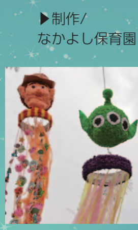
制作/ なかよし保育園