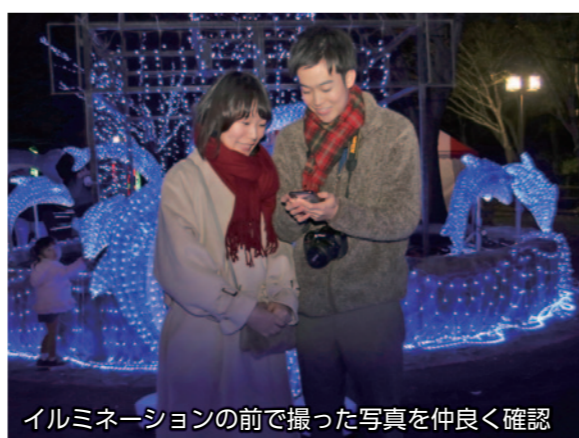
イルミネーションの前で撮った写真を仲良く確認