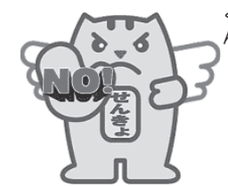
くたくた! 明るい選挙のめいすい