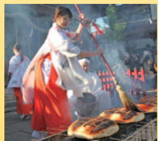
▼焼き上がったまんじゅうが見物客に振る舞われます