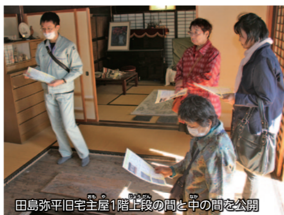
田島弥平旧宅主屋1階上段の間と中の間を公開