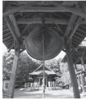
▲石山観音の大鰐口

オートレース 初心者ガイドツアー 事業課(☎245780) 期間 1月9日(木)から13日(祝)まで 時間 午前11時50分、午後2時20分、3時25分 ※所要時間は20分程度です