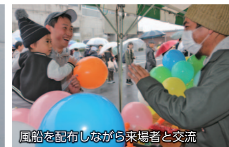
風船を配布しながら来場者と交流