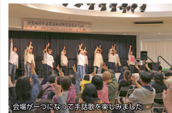
会場が一つになって手話歌を楽しみました

11月24日、絆の郷(円形交流館)で「手話言語条例制定記念イベント」が開催され、聴覚障害者が日常生活で困ることやコミュニケーション方法を取り上げた劇や、手話を使った漫才などが披露されました。イベントの最後には、参加者全員で覚えた手話を使って、SMAPの「世界に一つだけの花」を歌いました。