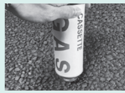
▲火気のない屋外で

カセットコンロで使い切るか、缶を逆さまにし、コンクリートなどに押し付けて中身を出し切る。