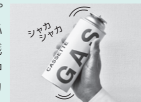
▲振ってみて中身の残りがああるか確認

カセットボンベ・スプレー缶を捨てる前に、必ず缶を振って、中身が残っているか確認する。中身がある場合は「シャカシャカ」、「チャプチャプ」と音がする。