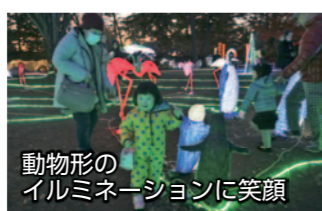
動物形のイルミネーションに笑顔

12月1日から25日まで、華蔵寺公園で「いせさきイルミネーション2019 in 華蔵寺」が開催されました。園内は、フラミンゴやペンギンなどが集まった光る動物たちの空間や周囲が青く染められた幻想的な空間、ピンク色のハートで彩られた空間など、趣向を凝らしたさまざまな空間に演出され、訪れた多くの人たちはその光景に魅了されていました。