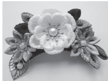
▲教室で作る作品例

市役所地域包括支援センターへ はじめてのつまみ細工教室 あずま公民館 (☎62-0115) 期日 1月20日(月)・27日(月)(全2回) 時間 午後1時30分~3時30分 ▲教室で作る作品例