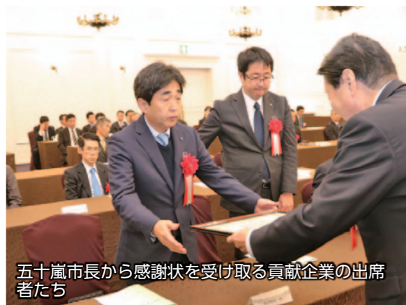
五十嵐市長から感謝状を受け取る貢献企業の出席者たち

11月12日、プラザ・アリア(喜多町)で「産業振興貢献企業表彰式」が行われました。市内の企業に多くの仕事を発注し、本市の産業振興に貢献したとして、市内の企業から推薦された15社が貢献企業に選ばれました。表彰式では、本市の産業振興への貢献に感謝し、五十嵐市長から以下の貢献企業の皆さんに感謝状が贈られました。