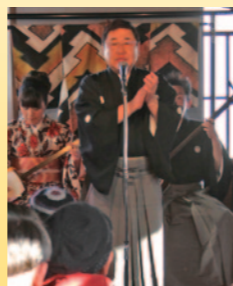
▲心温まる素敵な演奏会