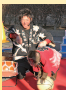
▲さまざまな芸を披露