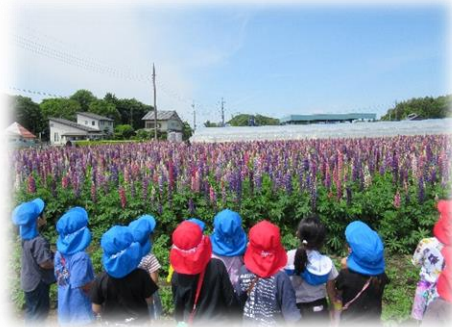
幼稚園のお花畑「ルピナス」