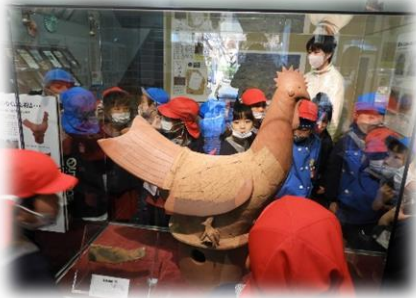
歴史民俗資料館の見学