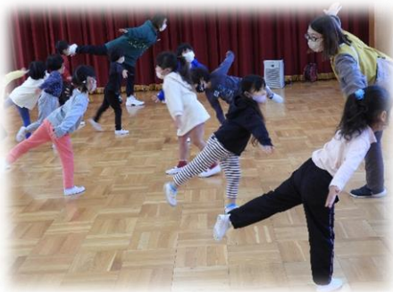
ヒップホップダンス