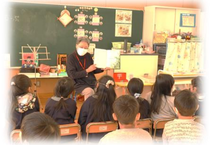
地域の人による読み聞かせ