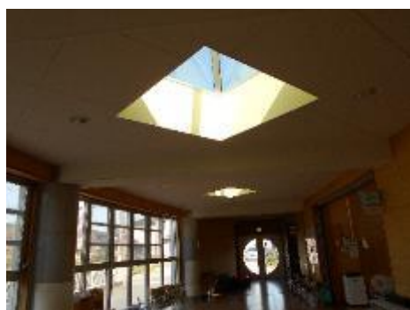
三角の明かりとりの天井や 保育室と続きの広い廊下