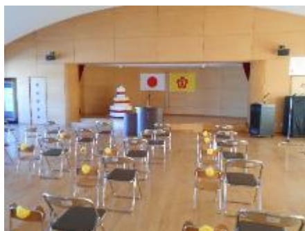
円形の絵本コーナーや 広い遊戯室