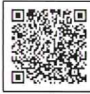
群馬県マッチングサイト

群馬県または他の都道府県が開設する マッチングサイト に掲載された対象求人に応募して採用された方