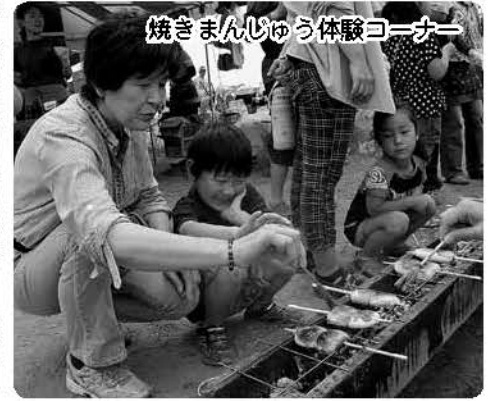
焼きまんじゅう体験コーナー