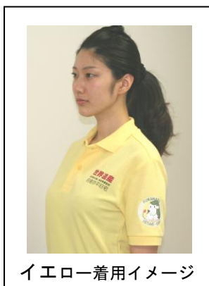
イエロー着用イメージ