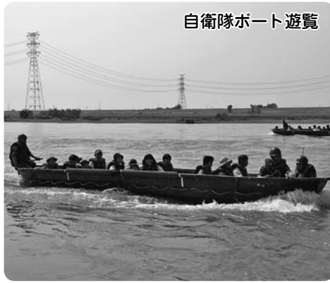
自衛隊ポート遊覧