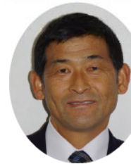
谷口浩美さん 世界陸上男子マラソン 金メダリスト オリンピック2大会出場