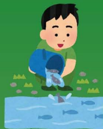
捕獲した生きものを（在来種）を水を戻した池に放流する