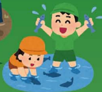
すんでいる生きものを捕獲する