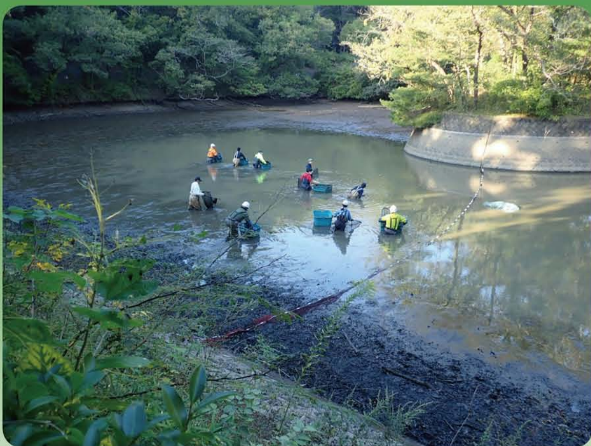
かいぼり作業風景