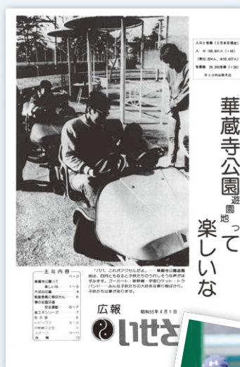
▲年月がたっても変わらないゴーカートやバッテリーカーを楽しむ家族(上：昭和55年4月1日発行の広報紙面、下：令和元年10月16日発行の広報掲載写真)