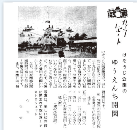
▲華蔵寺公園遊園地の開園当日の様子を伝える広報紙面(昭和45年5月16日発行)

市内に「子どもの遊び場を」という声に応えて華蔵寺公園野球場跡地にオープンした華蔵寺公園遊園地。当時の乗り物は①豆電車②ゴーカート③宇宙ロケット④ティーカップ⑤チェンタワー⑥トラバンド⑦バッテリーカーと小型乗り物18種類。乗り物券は1枚50円だった。