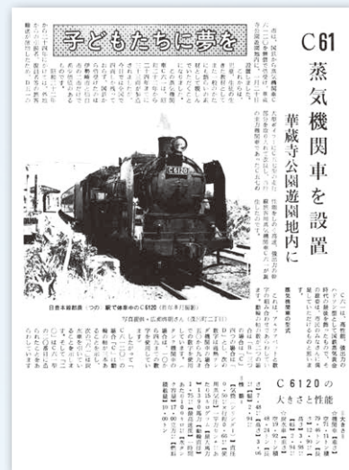
▲設置された蒸気機関車(C6120)について、その大きさや性能などについて詳しく紹介した広報紙面(昭和49年2月1日発行)

この年の前年まで九州で走っていた蒸気機関車で、平成22年1月にJR東日本による復元のために搬出されるまでの36年に渡り遊園地に設置され、遊園地のシンボルとして親しまれた。