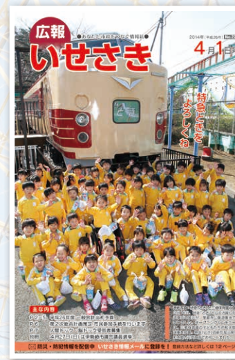
▲ランチトレインのオープニングセレモニーで和太鼓の演奏を披露してくれた子どもたち(平成26年4月1日発行)

「特急とき」などとして走っていた車両(183系)をJR東日本から譲り受け、車内で弁当などを食べられる休憩施設として設置。遊園地の新たなシンボルとして親しまれている。