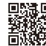
▲市ホームページ新型コロナウイルス関連の情報ページ