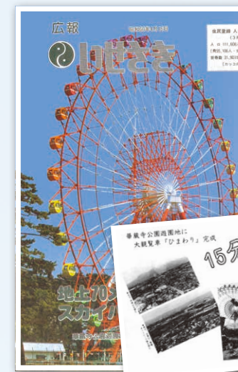
▲大観覧車「ひまわり」のオープン当日の盛りだくさんな広報紙面(昭和60年4月16日発行)

高さ65メートルの大観覧車は前年に開催された「とちぎ博」に設置された物を移設した。オープン初日には開園前から多くの人々が列を作り、約3,000人が乗車。この年、乗り物券を1枚60円に変更し、平成7年から現在まで1枚70円。