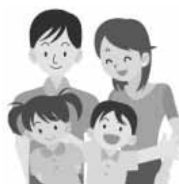
日程表（5月から平成22年3月まで）

入園前の子どもとその保護者に幼稚園を開放し、遊びの場を提供します。 子どもや保護者のふれあいの場として、また情報交換の場として気軽にご利用ください。 会場・期日 下表のとおり 期日は変更になる場合があります 時間 午前9時30分～11時 内容 園内の遊具を使って、親子で一緒に楽しく遊べます 子育てについて、保護者同士で情報交換ができます 子育てに対する悩みや不安について、幼稚園の教諭などに相談ができます 参加料 無料 問い合わせ 各会場