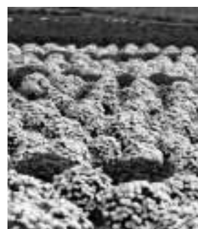
あかぼり小菊の里

小菊の栽培・管理などは、有志でつくる「あかぼり小菊の里づくりの会」が、ボランティアで手掛けています。同会では、作業に協力できる人を募集しています。花の栽培などに関心がある人は、ぜひご参加ください。 対象 土・日曜日などの休日に作業ができる人 内容 小菊の植え付け作業など 報酬はありません 申し込み・問い合わせ 文化観光課（内線3404）または赤堀経済振興室（☎629791）