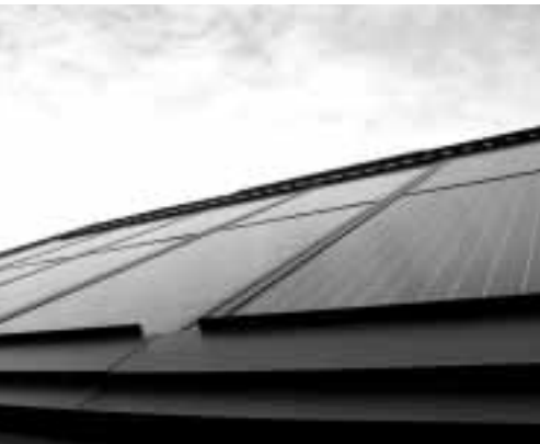
屋根に設置された太陽光発電モジュール

電気代を減らしながら、地球温暖化対策に協力できることは、とても良いことだと思います。