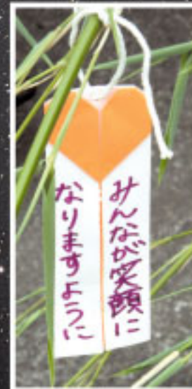
願いを短冊に込めて