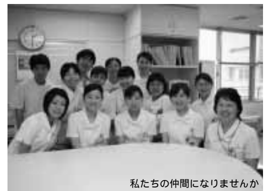
私たちの仲間になりませんか

市民病院では、平成22年4月採用の職員採用試験を行います。試験区分・採用予定人数・受験資格は、左下表のとおりです。 試験日 1次試験 9月12日（土） 2次試験 10月8日（木） 試験内容 1次試験 専門試験・小論文 2次試験 面接 問い合わせ 市民病院企画財政課（☎255022） 申し込み 申込書に必要な事項を記入し、市民病院企画財政課に本人または代理人が持参してください。 郵送などでの申し込みはできません 試験案内・申込書は、市民病院企画財政課（市民病院本館2階）にあります。また、市民病院のホームページからダウンロードもできます 期間 8月3日（月）から31日（月）まで 土・日曜日は除きます 時間 午前9時～午後5時