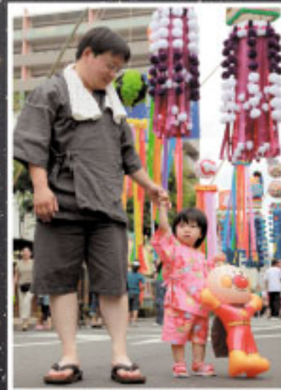
仲良くおまつり散策