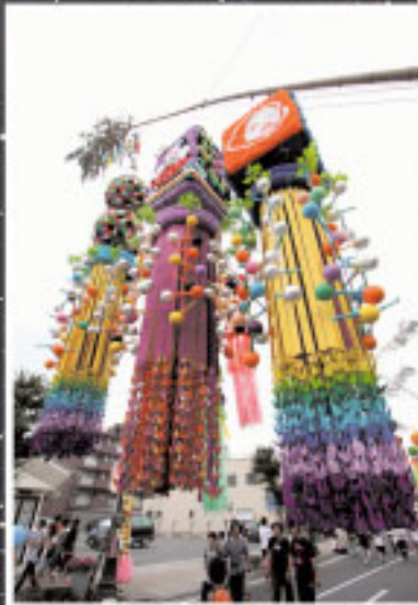
見事に飾られた七夕飾り