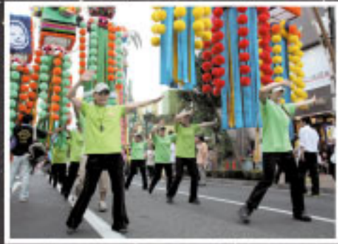
ダンピア流しが、七夕飾りの下で元気よく繰り広げられました。軽快な音楽と勢いあるダンスが、まつりを盛り上げました。