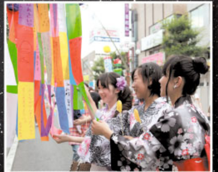
楽しい願い事に笑顔がこぼれる