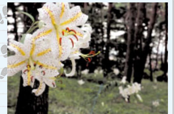
小さな山に魅力がいっぱい