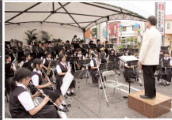
にぎわい広場では、吹奏楽の演奏(写真上)やフェイスペイント(写真右)、白パイ体験、ボクシング体験など、さまざまな催しが行われました。