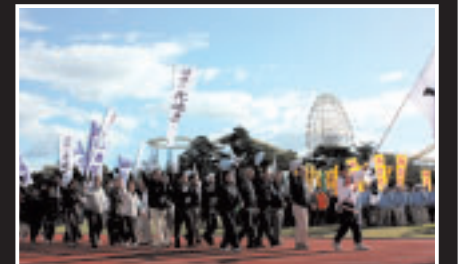
堂々とした入場行進