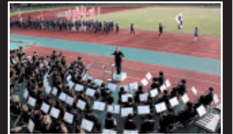
開会式を盛り上げた吹奏楽の演奏