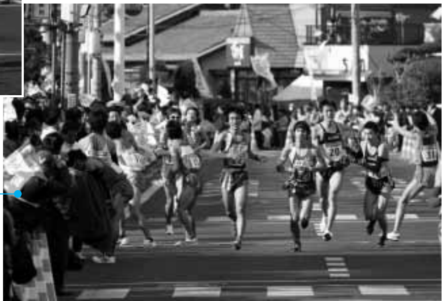
混戦中のタスキリレー