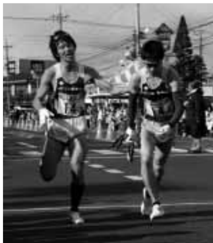
本県から参戦したスバルチーム

平成21年12月28日、つくし保育園の子どもたちが、園内でもちつきを行いました。寒空の下でも子どもたちは元気いっぱい。大きな掛け声とともに、力強く杵を振り下ろし、おいしそうなおもちをつき上げました。