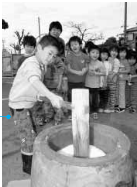
元気よくもちつきをする子どもたち