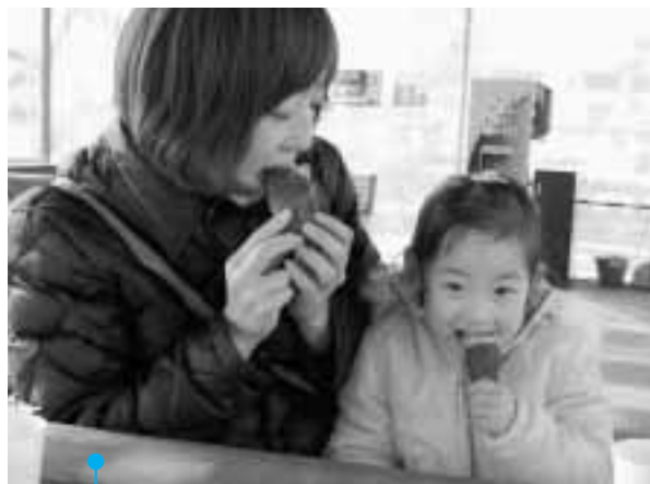
「おいしいね」とほほ笑む親子

昨年度好評だった焼きいもハウスが、華蔵寺公園遊園地に登場しました。焼きいもに加えて、今年は焼きバナナもメニューに加わり、来場者は焼きたてのいもやバナナを、おいしそうにほお張っていました。