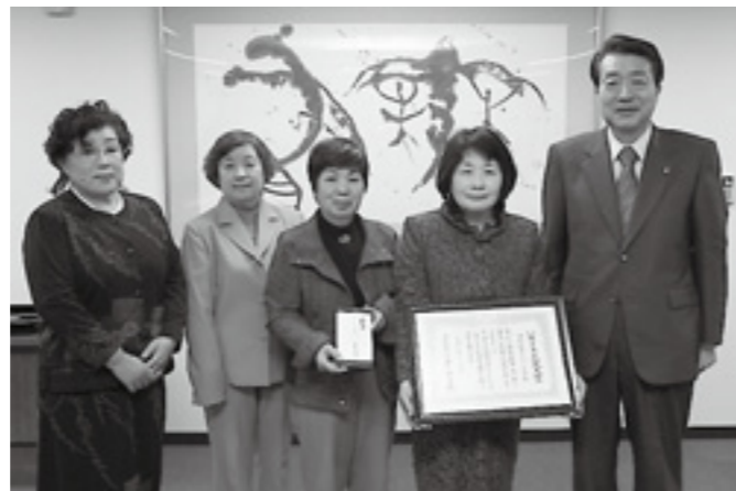
▲伊勢崎市くらしの会の皆さん