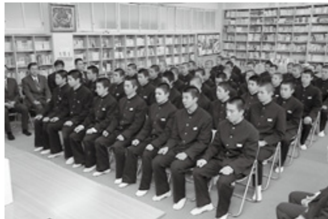
▲第三中学校野球部