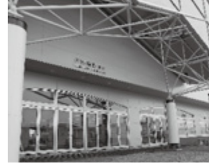
▲JR伊勢崎駅の新しい駅舎

現在、JR両毛線と東武伊勢崎線の連続立体交差事業が進められています。JR両毛線は、高架橋と新しい駅舎が完成しました。新しい駅舎は、南北から入場できます。改札は1階、ホームは2階になり、エレベーターとエスカレーターが設置されています。 高架橋への切り換えは5月30日(日)の始発電車から、以後は切換え区間のJRの踏切は遮断しなくなります。