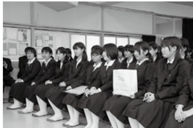
▲第一中学校吹奏楽部