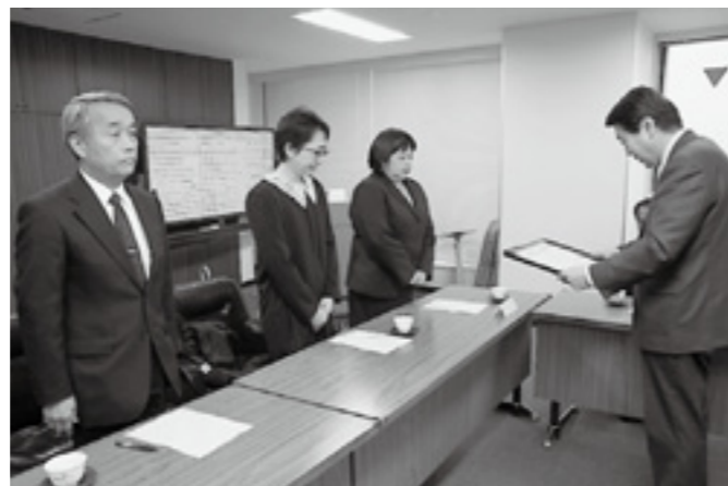
▲殖連第二小学校学校支援ボランティアうえにの森の皆さん