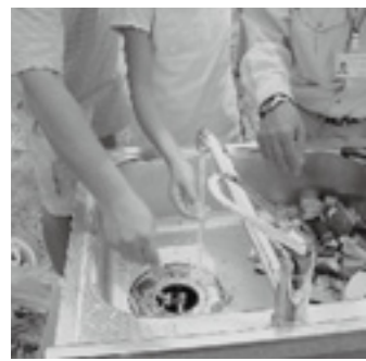
▲生ゴミがたまる便利なディスポーザ

ディスポーザをご利用ください 4月1日から公共下水道伊勢崎処理区域の一般住宅で、ディスポーザが使えるようになりました。ディスポーザは、流し台の排水口に取り付け、家庭内で発生する生ゴミを粉碎し、水と一緒に下水道に直接排出する装置です。 ※赤堀・東・境地区では利用できません 申し込み 本市の下水道排水設備指定工事店を経由し、必要書類を添えて下水道管理課へ ※ディスポーザの設置には補助制度があります。補助額の上限は本体購入価格の半額(上限2万円)です。詳しくはお問い合わせください 問い合わせ 下水道管理課 (内線2258)