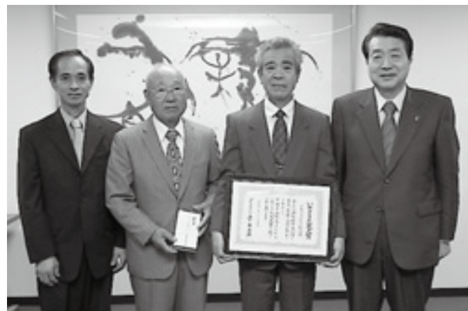
▲小泉コスモス組合の皆さん