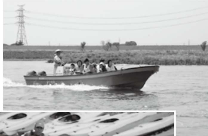
▶水しぶきを上げて通航する渡船「島村の舟」