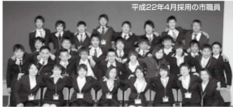
▶私たちと一緒に働かせませんか

申込書に必要事項を記入し、下表の申込受付期間内に直接または郵送で職員課へ あて先 〒372-8501 今泉町二丁目410 市役所職員課 注意事項 平成23年4月採用の消防職員・市民病院医療事務の募集