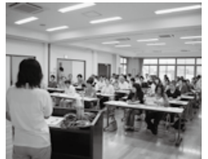
▲介護予防サポーター研修

「お金の管理やいろいろな契約に関することに不安があるが、頼れる家族がない」という人は、成年後見制度が利用できます。地域包括支援センターでは、この制度や手続きの方法などを説明しています。