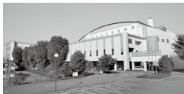
▲清掃リサイクルセンター21

市有バスで、市内の施設4か所を見学します。ぜひご参加ください。 期日 7月2日(金) 時間 午前9時30分~午後3時30分 見学コース 市役所↓清掃リサイクルセンター↓第二学校給食調理場(給食の試食)↓伊勢崎オートレース場↓伊勢崎消防署↓市役所 ※市有バスを使用します 定員 28人(抽選) 参加料 無料 申し込み住所・氏名(ふりがな)・年齢・性別・電話番号を記入し、はがき・ファクス・Eメールで広報課へ あて先 〒372-8501 今泉町二丁目410 市役所広報課「市民施設見学会」係 ファクス番号 (23)9800 Eメールアドレス kohou@city.isesaki.lg.jp 締切日 6月18日(金) ※当日消印有効 問い合わせ 広報課(内線5405)