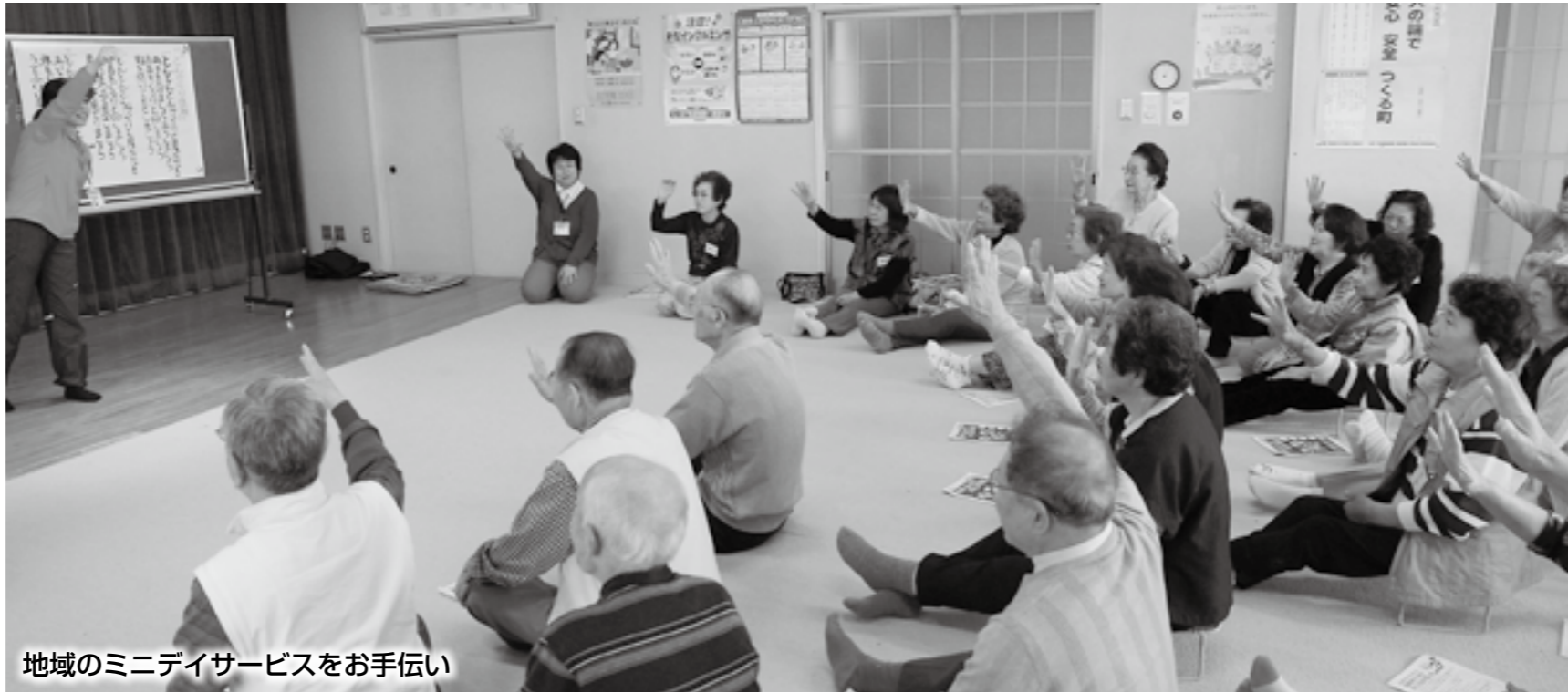
地域のミニデイサービスをお手伝い

地域包括支援センターは、介護予防サポーター研修や介護予防フェスタなどを行っていて、見えにくいけれど身近な存在です。困ったときなど、気軽に電話してみてもいいでしょうか。