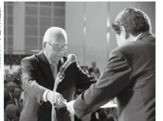
▶感謝状を贈られる代表者

5月16日、島村渡船フェスタが利根川左岸の渡船乗り場周辺で開催されました。利根川や広い河川敷を利用して、カヌーの乗船体験や自衛隊ボートによる利根川遊覧、マス釣りなどが行われました。大勢の来場者は、初めて乗る渡船や多彩なイベントに参加して、楽しい一日を過ごしていました。