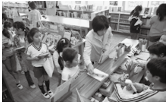
◀休み時間、図書室の貸し出しカウンターには、子どもたちが行列を作ります