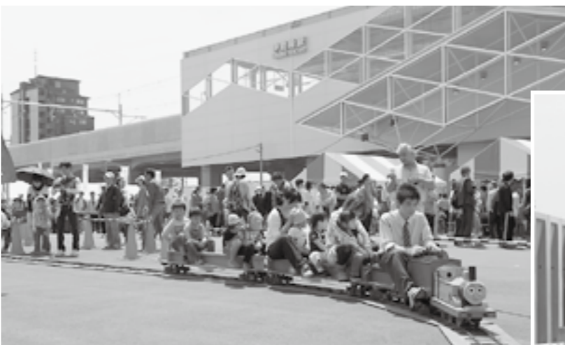
▶ミニ鉄道で北口駅前広場を一周り

5月13日、行政団体合同感謝状贈呈式が文化会館で開催されました。昨年度退任した区長・環境指導員・防犯委員の計306人へ、市政の発展と住民福祉の向上への貢献・功績に対する感謝状が贈られました。