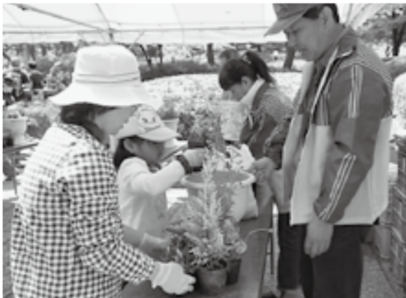
▶寄せ植え教室で緑と土に親しむ

5月1日・2日、グリーンフェスタ2010が華蔵寺公園で開催され、緑に親しんでもらうための苗木の配布や寄せ植え教室のほか、和太鼓・吹奏楽の演奏、ダンスショー、魚のつかみどりなどが行われました。来場した皆さんは、初夏を思わせるさわやかな日差しの下、真っ赤なツツジに彩られた園内で、さまざまなイベントを楽しんでいました。