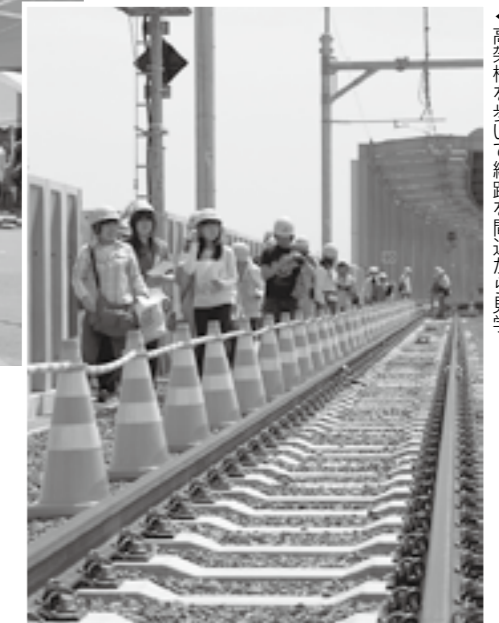
▶高架橋を歩いて線路を間近から見学

5月16日、JR両毛線高架施設見学会と完成記念イベントが伊勢崎駅で開催されました。新駅舎の施設見学や高架橋のウォーキングのほか、広く整備された北口駅前広場では、吹奏楽の演奏や伊勢崎工業高校によるミニ鉄道、物品販売などが行われ、多くの家族連れや鉄道愛好者でにぎわいました。