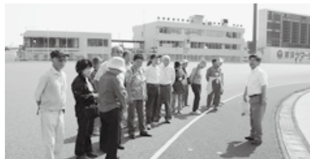
▲伊勢崎オートレース場