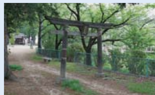
旗本久永氏陣屋跡 (市指定史跡)

本市では、これから花ショウブの開花に合わせた催しや、七夕・夏まつりなどイベントが目白押し。皆さんも、帽子をかぶったり、日傘を差したり、日焼け止めクリームを塗ったりして、日焼け対策を十分に、出掛けましょう。(と)