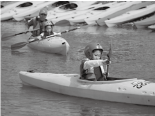
▶カヌーに乗って川を身近に感じます