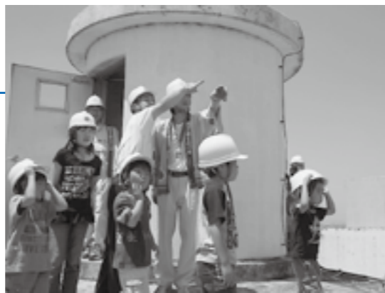
▲調整塔の屋上で景色を楽しむ参加者

6月6日、水道週間のイベントとして「竜宮浄水場見学会」が開かれ、多くの人を訪れました。参加者は水が届く仕組みや調整塔の説明を受け、水道施設の大切さについて学びました。最後は高さ35mの調整塔の頂上まで登って、普段見ることのできない景色を堪能しました。