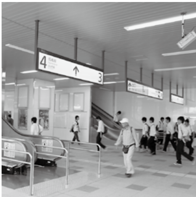
本市の玄関口であるJR両毛線伊勢崎駅が、広く・明るくなりました。エレベーターやエスカレーターが設置されたバリアフリー構造で、南口と北口は自由通路でつながっています。