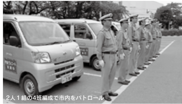
2人1組の4班編成で市内をパトロール