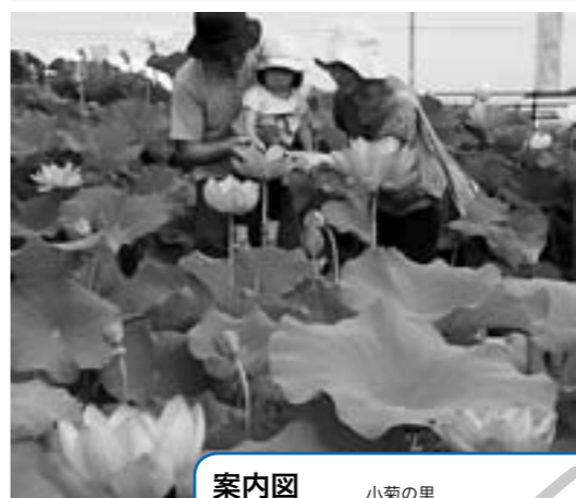
▲涼やかな大輪の花が、訪れた人を迎えます

天幕城址 あかぼり蓮園は、緑豊かな天幕城外堀跡(磯町)に、日中国交正常化30周年を記念して、在日中国大使から平成14年に譲り受けた中国蓮を植え付け、開園しました。 白やピンクの大輪の花が早朝から午前中にかけて一斉に咲きそろう、暑い夏をすがすがしく感じさせてくれます。 蓮の花は、7月上旬から8月中旬まで楽しむことができます。ぜひお出掛けください。 問い合わせ 赤堀経済振興室 ☎(62)1151・文化観光課(内線3452) 期日 7月18日(日) ※荒天の場合は19日(祝)に行います 時間 午前9時～11時30分 会場 あかぼり蓮園駐車場 内容 花の苗・豚汁・かき水の無料配布 ※数に限りがあります 【フラワーアート教室】 定員 50人(先着順) 内容 蓮の花を使ったフラワーパーティ作り 参加料 300円 ※参加者に手ぬぐいをプレゼントします