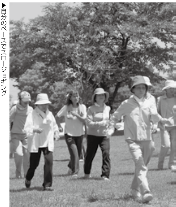
▶自分のペースでスロージョギング

6月8日、市民サービスセンター宮子がいせさきガーデンズ(宮子町)内に移転しました。税関係の証明書の発行や市税の納付もできるようになりました。また、年末年始を除いて年中無休で開所しているので、より利用しやすくなりました。