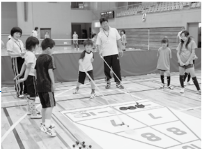
▲ディスクを押し出して高得点を狙うシャフルボード

6月6日、「市民レクリエーションスポーツ祭」が華蔵寺公園運動施設などで開催されました。参加した皆さんは、サイクリングやなわとびなどの身近なスポーツのほか、インディアカやシャフルボードなど普段なかなか体験できないスポーツに汗を流し、楽しんでいました。