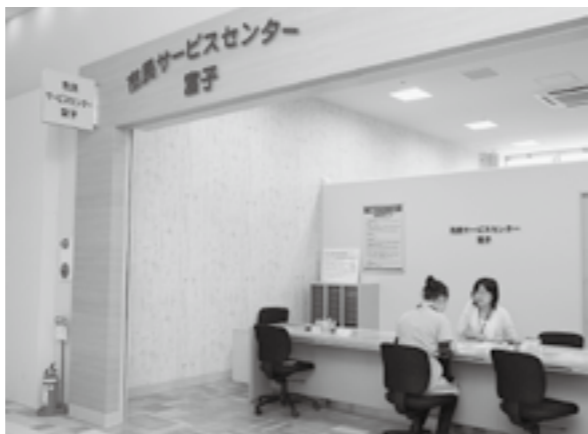
▲明るく開放感のあるサービスセンターの窓口