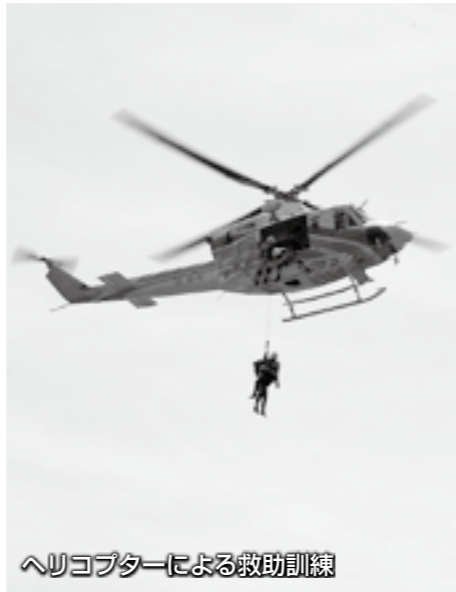
ヘリコプターによる救助訓練