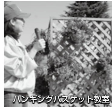
ハンギングバスケット教室

当日、イベントのお手伝いをしてくれる人を募集します。 時間 午前8時30分～午後3時 対象 高校生以上 定員 20人程度(先着順) 申し込み 8月9日(月)から31日(火)までに公園緑地課へ