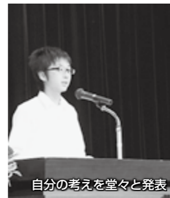
自分の考えを堂々と発表

7月18日、「サンドアートコンテスト」が、友好親善都市、新潟県長岡市の寺泊中央海水浴場で開催されました。梅雨が明け、気持ちよく晴れた会場に集まったのは、地元の皆さんも含めて全25チーム。本市からは12チームが参加して、真夏の太陽が照りつける中、サンドアートの出来を競いました。参加した皆さんは、家族や友人と力を合わせて、海水浴場の砂で思い思いのサンドアートを完成させ、夏のひとときを楽しんでいました。