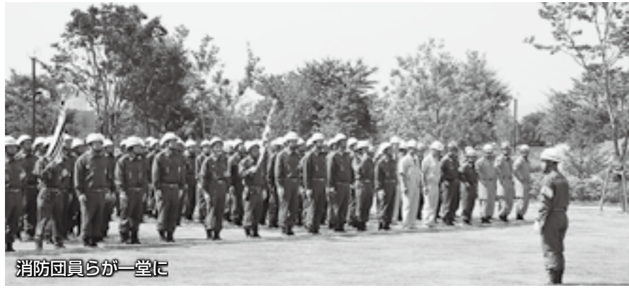
消防員らが一堂に