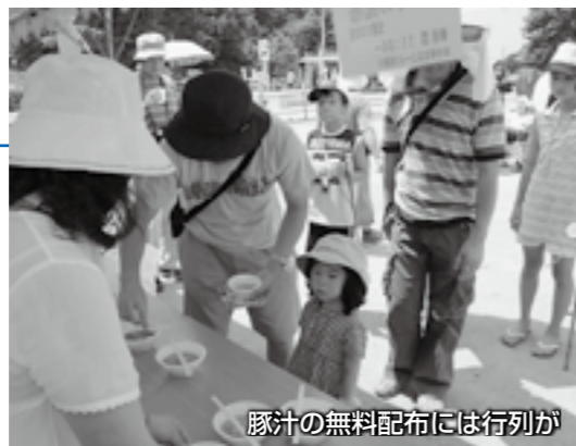
豚汁の無料配布には行列が

7月18日、あかぼり蓮園まつりが同園で開催されました。日中国交正常化30周年を記念して贈られた美しい中国ハスの姿を見ようと、園内は朝早くから、たくさんの来場者でにぎわいました。また、かき氷・地場産野菜・花の苗・豚汁の無料配布や、フラワーアート教室のイベントが行われ、来場者を楽しませていました。