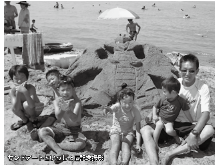
サンドアートといっしょに記念撮影