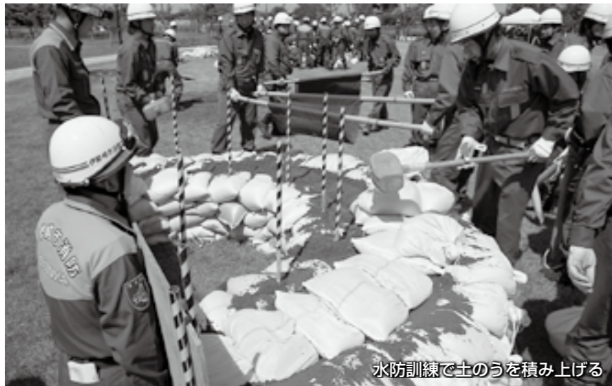
水防訓練で土のうを積み上げる