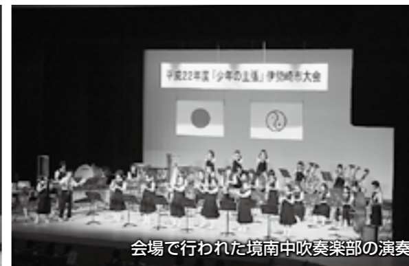
会場で行われた境南中吹奏楽部の演奏