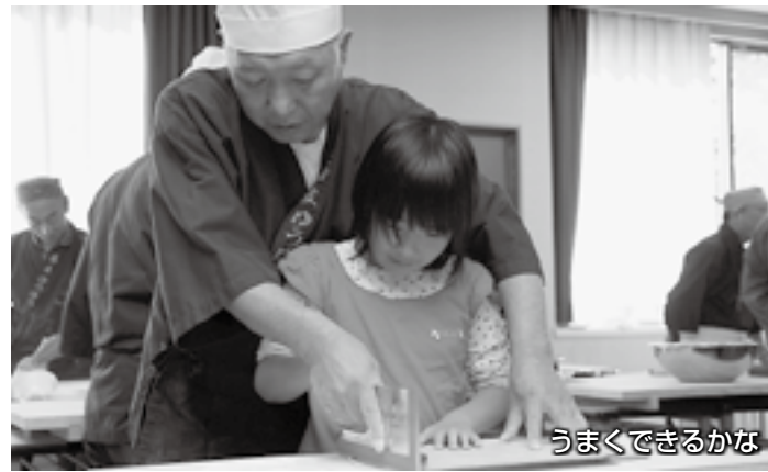
うまくできるかな