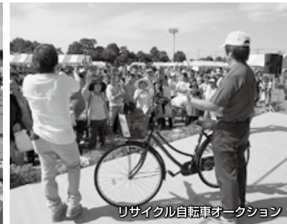
リサイクル自転車オークション