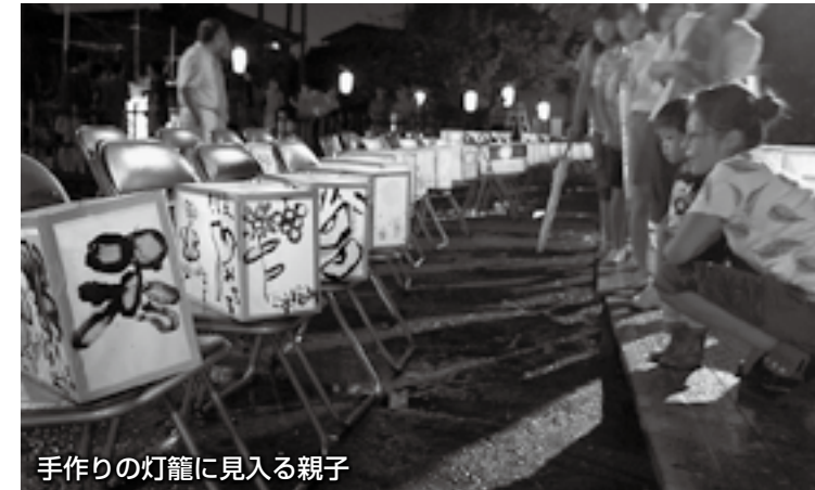
手作りの灯籠に見入る親子

9月18日、県立伊勢崎商業高等学校の吹奏楽部を招き、ナイトコンサートがまゆドームで開催されました。来場者は、夜の公園の幻想的な雰囲気の中で、美しい演奏を楽しみました。