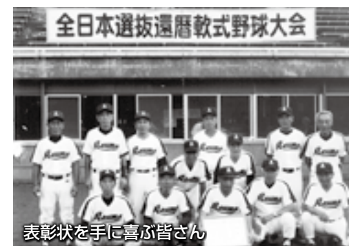
表彰状を手に喜ぶ皆さん

9月14日、「知的障害児(者)福祉集会」が清掃リサイクルセンター21ほか3会場で開催されました。参加した皆さんは、知的障害児(者)に対する理解と福祉の向上のための活動を続けることを誓い合いました。