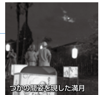
つかの間姿を現した満月

9月22日、市指定重要文化財旧森村家住宅で「十五夜の集い」が行われました。あいにくの雨の中での始まりでしたが、途中雨が上がり、訪れた来場者は、顔を見せた満月と庭を埋め尽くした灯籠の明かりの競演を楽しみました。