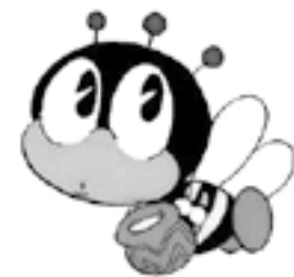
生涯学習のマスコット「マナビィ」