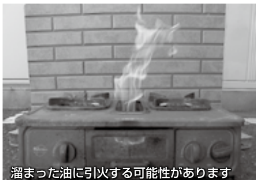
溜まった油に引火する可能性があります

ガスコンロの魚焼きグリルから火が出たという事故が続いています。掃除せずにグリルを使い続け、内部に汚れた油が溜まってしまったことが、事故の原因です。この事故は、大きな火災に繋がる危険性があります。グリル内の掃除は小まめに行い、調理中はガスコンロから離れないようにしてください。