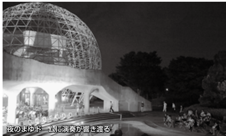
夜のまゆドームに演奏が響き渡る