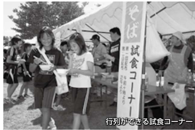
行列ができる試食コーナー