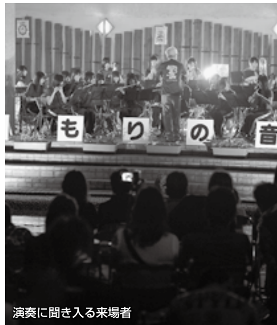
演奏に聞き入る来場者