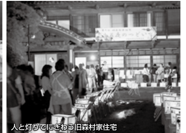
人と灯りでにぎわう旧森村家住宅