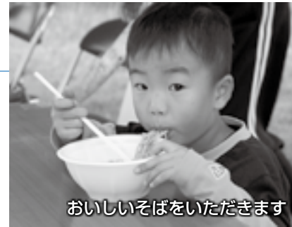
おいしいそばをいただきます

9月25日、「そばの里はなまつり」が青少年育成センター・グリーンパークで行われました。地元産のそば粉を使ったそばの試食コーナーに訪れた皆さんは、秋晴れの空の下で実りの秋を堪能していました。また、そば打ち体験では、慣れない手つきながら皆さんの手で、さらさらのそば粉がおいしいそばに生まれ変わっていました。