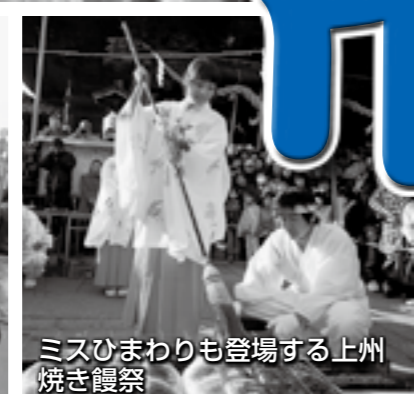
ミスひまわりも登場する上州焼き饅頭

新春恒例の「いせさき初市」が開催されます。本町通り周辺には、200店を超える露店が立ち並びます。上州焼き饅頭を始めとするさまざまなイベントも行われます。皆さん、ぜひお越しください。