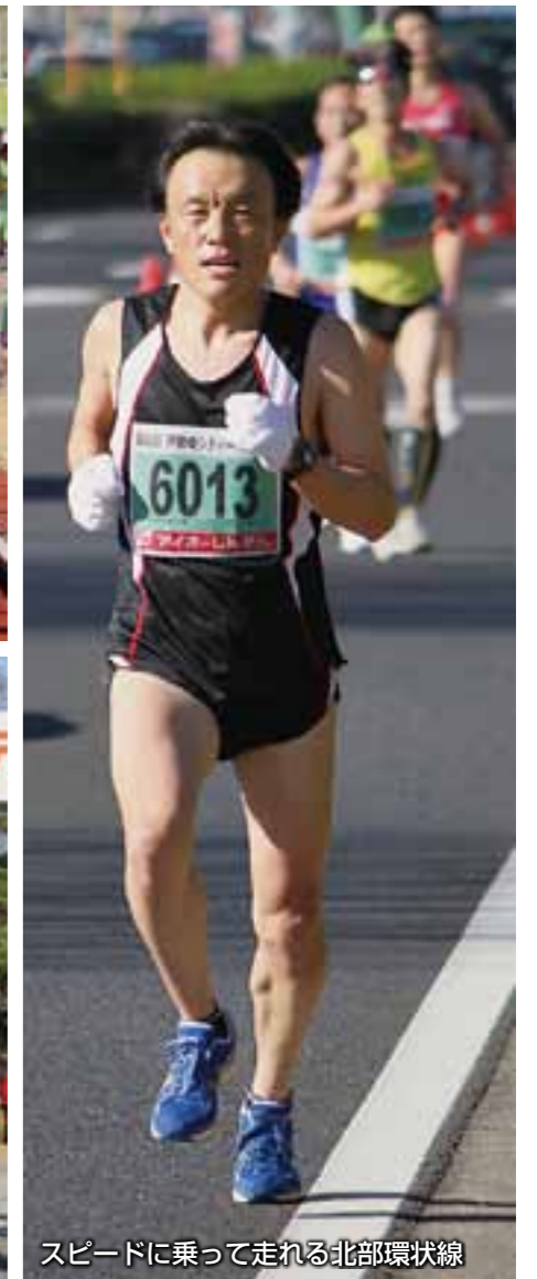
スピードに乗って走れる北部環状線