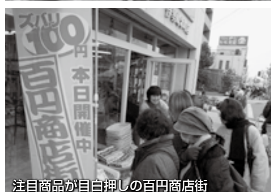
注目商品が目白押しの百円商店街