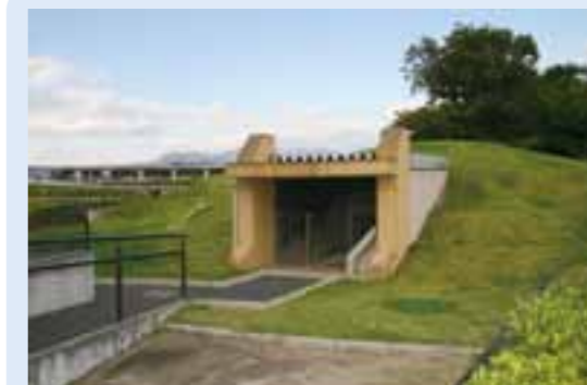
一ノ関古墳(市指定史跡)

さて新しい1年の始まりです。本年もいろいろな所に取材に行く予定ですが、なにがあるか今から楽しみです。(か)