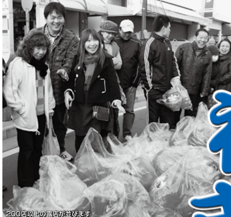
200店以上の露店が並びます

時間 正午～午後9時30分 会場 本町通りほか 問い合わせ 文化観光課 (内線3452) 商工会議所 (☎242211)