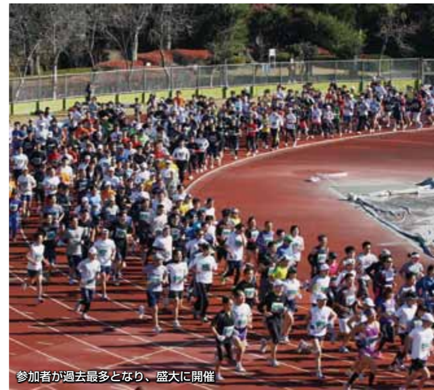
参加者が過去最多となり、盛大に開催

12月5日、市陸上競技場付設コースで、伊勢崎シティマラソンが開催されました。参加した1588人のランナーは、快晴の冬空の下、額に汗をにじませながら、伊勢崎路を気持ち良さそうに駆け抜けていました。