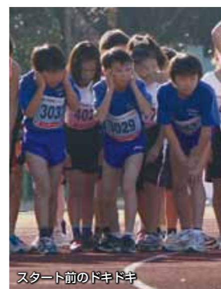
スタート前のドキドキ