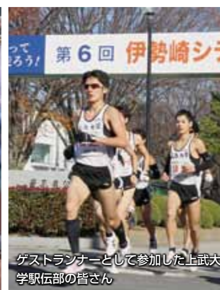
ゲストランナーとして参加した上武大学駅伝部の皆さん