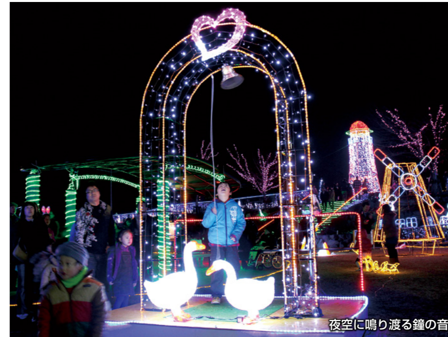
夜空に鳴り渡る鐘の音