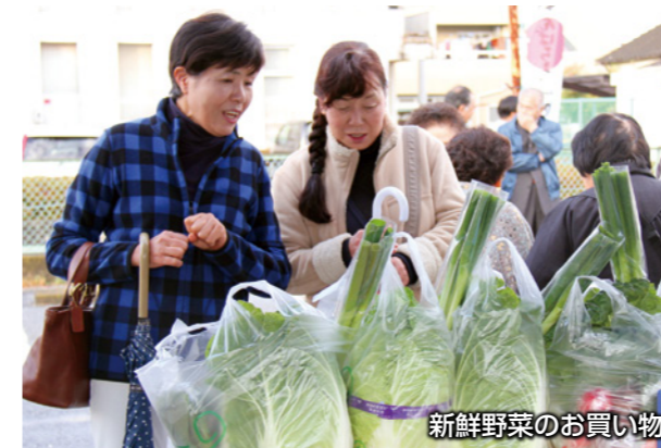
新鮮野菜のお買い物

12月3日、大手町で開催された「まちなか夕市」。JA佐波伊勢崎の農産物直売所「からかーぜ」による新鮮な地場産野菜の詰め合わせを中心に、総菜や果物などが格安で提供されました。徒歩や自転車での買い物客が多く、会場にはにぎやかな声が響いていました。