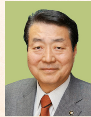
伊勢崎市長 五十嵐清隆

謹んで新春のごあいさつを申し上げます。 市民の皆さまには、健やかに新年をお迎えのことと、心からお喜び申し上げます。