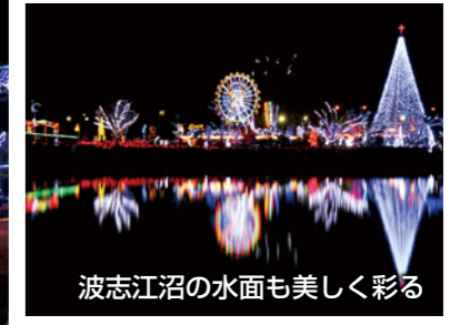
波志江沼の水面も美しく彩る