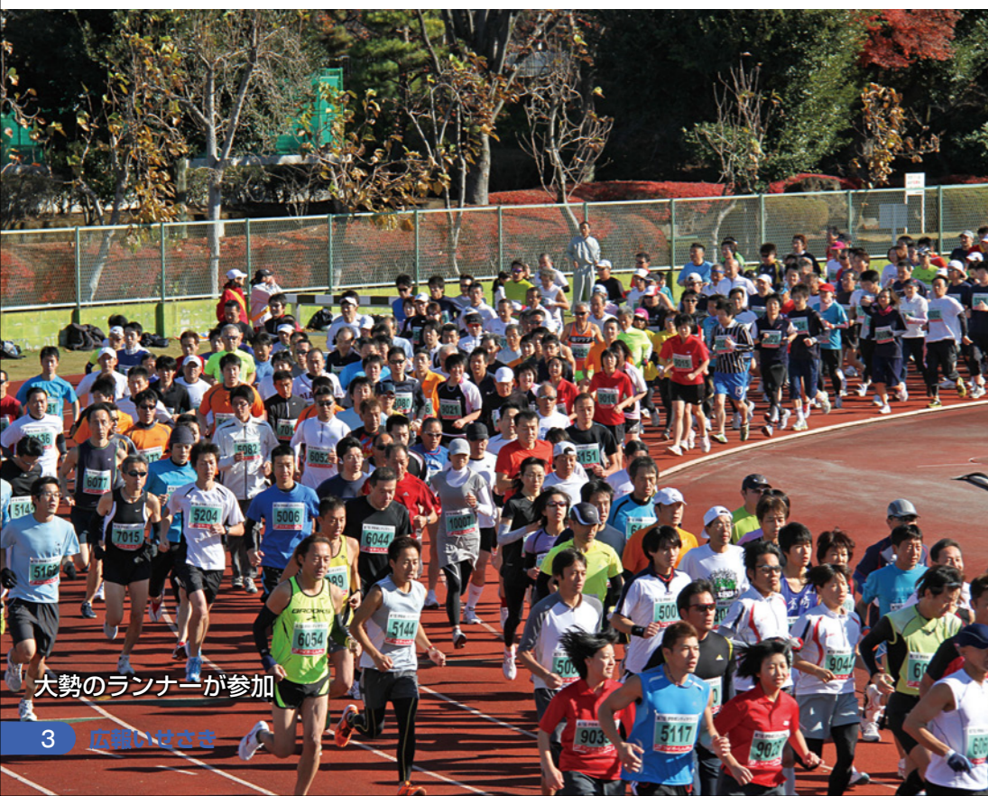
大勢のランナーが参加