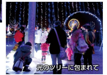
光のツリーに包まれて

12月3日から24日まで「がんばろう！日本 輝こう！いせさき」をテーマにした「イルミネーション・ナイト2011」が行われ、約60万個のLED電球で波志江沼環境ふれあい公園が飾られました。観覧車や時報鐘楼をモチーフにしたイルミネーションのほか、3回目となる今回は20メートルを超えるクリスマスツリーとまゆドームが初登場。夜の公園を訪れた人たちからは、美しい光の芸術に感嘆の声が上がりました。