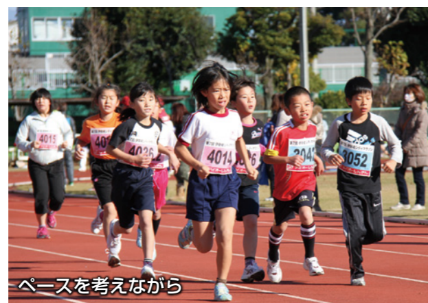
ペースを考えながら