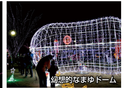
幻想的なまゆドーム