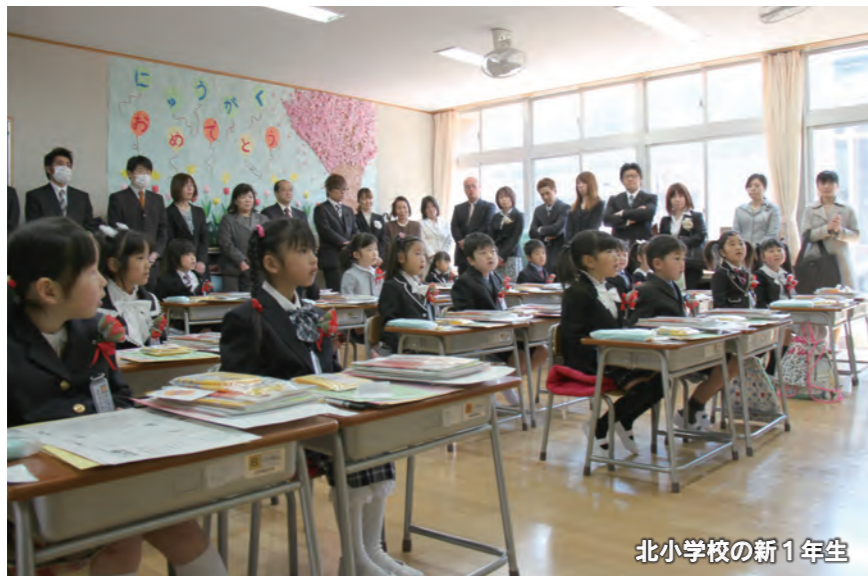
北小学校の新1年生