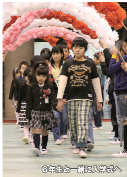
6年生と一緒に入学式へ