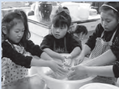
▲地場産食材でふるさとの味を再発見

●市内の俳諧マップを作成し、バスツアーを実施 ●市内の立体的な洪水ハザードマップを作成 など