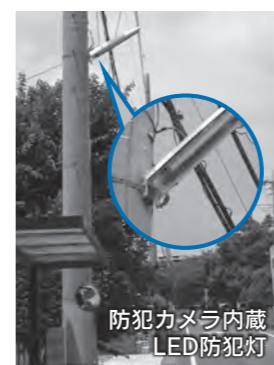
防犯カメラ内蔵LED防犯灯

旧森村家住宅(市指定重要文化財)は東日本大震災の影響により閉館していましたが、門や蔵などの修理を行い、一般公開を再開しました。 旧森村家住宅(市指定重要文化財)保護課(☎63-30030)