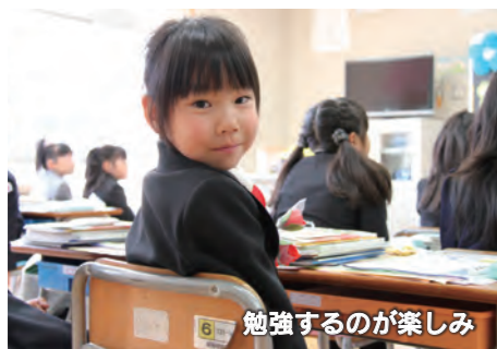
勉強するのが楽しみ

4月9日、市内の各小学校で入学式が行われました。本市では1,971人の1年生が誕生し、新たなスタートを迎えました。