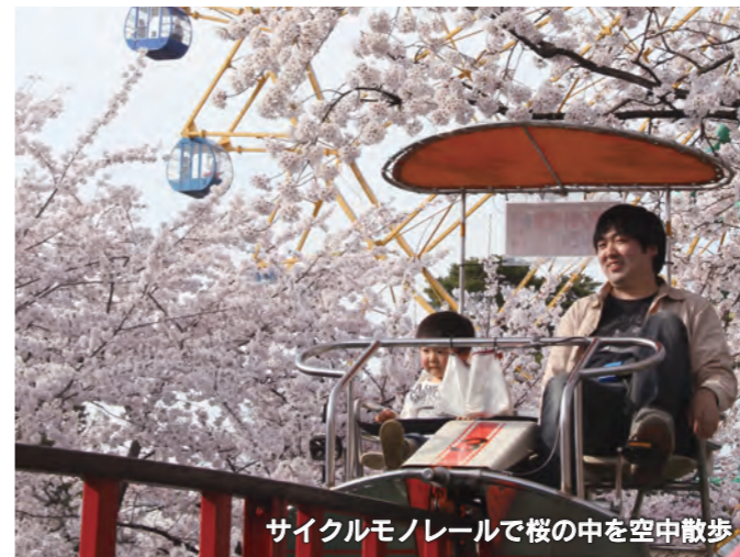
サイクルモノレールで桜の中を空中散歩