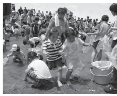
▲子どもに大人気、魚のつかみ捕り