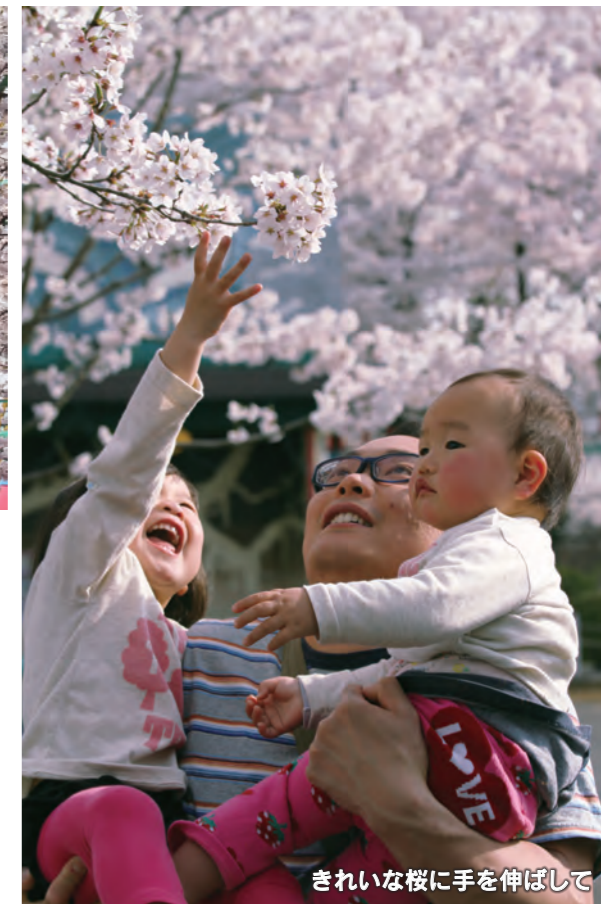
きれいな桜に手を伸ばして

4月1日から、「華蔵寺公園花まつり」が開催されています。華蔵寺公園遊園地内のヘリタワー前にある桜の基準木(ソメイヨシノ)が4月6日に開花。公園の桜は暖かい陽気に誘われて、12日ごろには満開となり見頃を迎えました。桜の開花時期に合わせて園内はライトアップされ、華蔵寺公園遊園地では夜間営業も行われるなど、夜遅くまで桜を楽しむ人でにぎわいました。