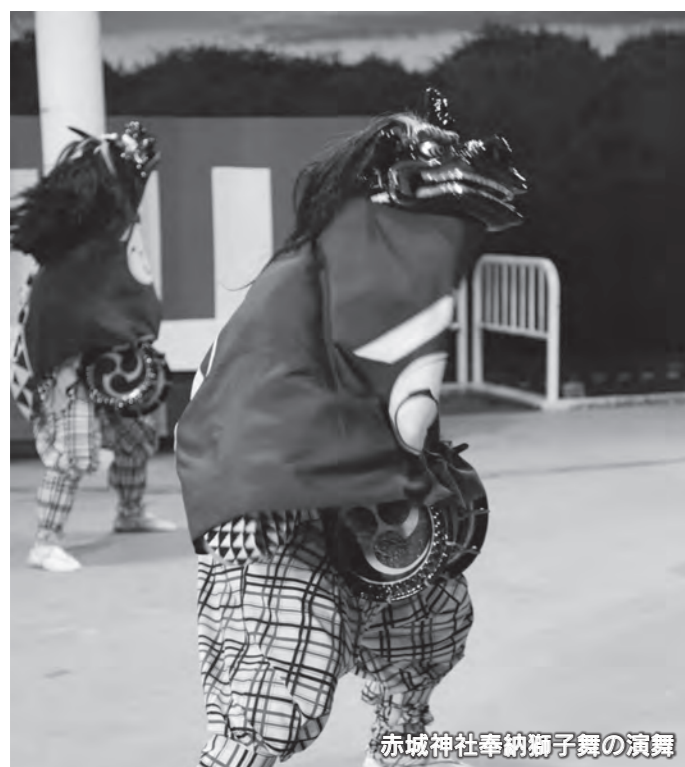
赤城神社奉納獅子舞の演舞