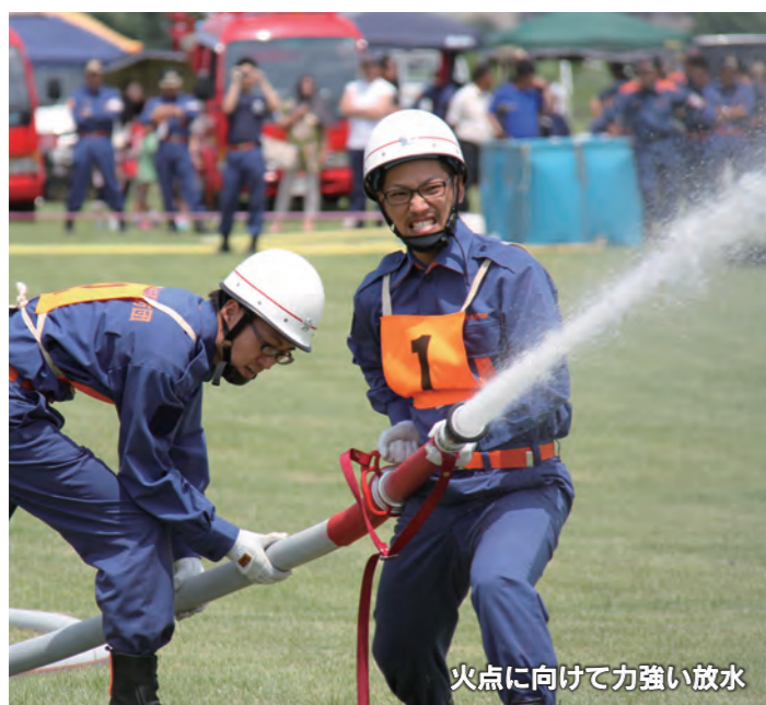
火点に向けて力強い放水