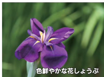
色鮮やかな花しょうぶ

6月10日、「あずま水生植物園まつり」が同園で開催されました。迫力ある上州あずま太鼓の演奏で幕を開け、野だてやお菓子のつかみ取り、花の苗の無料配布など、たくさんのイベントが行われました。