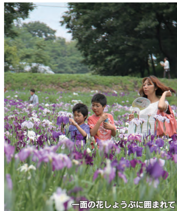
一面の花しょうぶに囲まれて