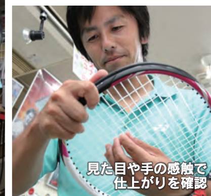
見た目や手の感触で仕上がりを確認