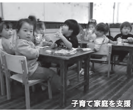
子育て家庭を支援

●安全対策 地域ふくし館うえはすでは、指定管理者による運営と併せ、就労支援事業を始めます。障害のある皆さんの社会参加を支援し、就労の機会の拡大を図ります。