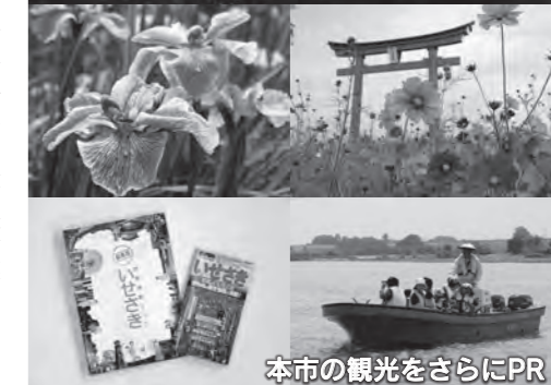
本市の観光をさらにPR

●都市基盤の整備 東毛広域幹線道路の境工区を完成させるとともに、名和幹線、市道（赤）112号線、外環状道路などの各地域の主要道路や生活道路の整備を推進します。