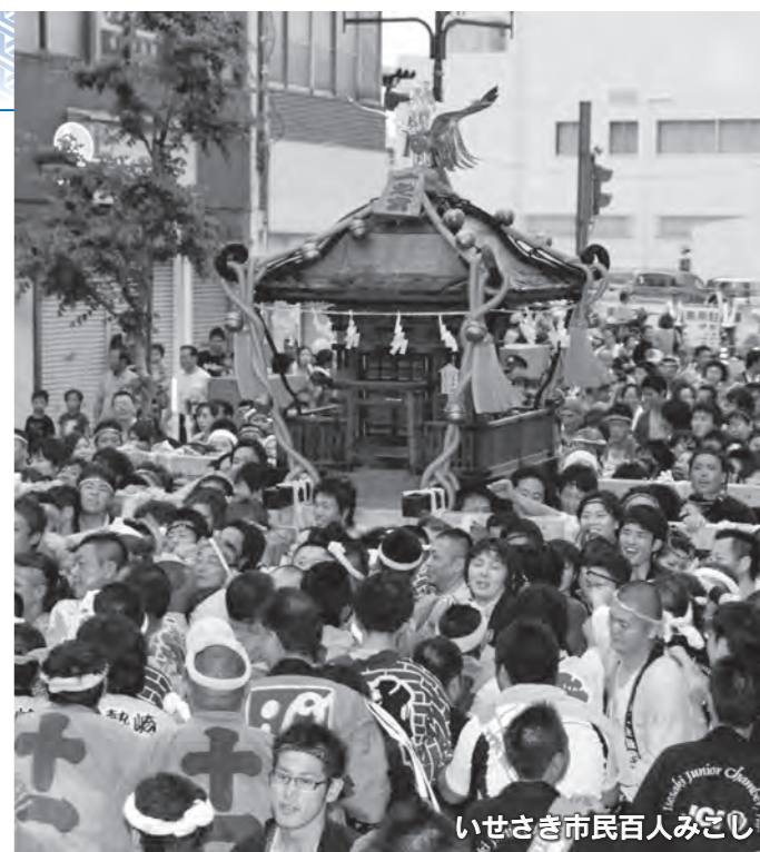
いせさき市民百人みこし

※天候により内容が変更になる場合があります 問い合わせ 文化観光課(☎27-2759)