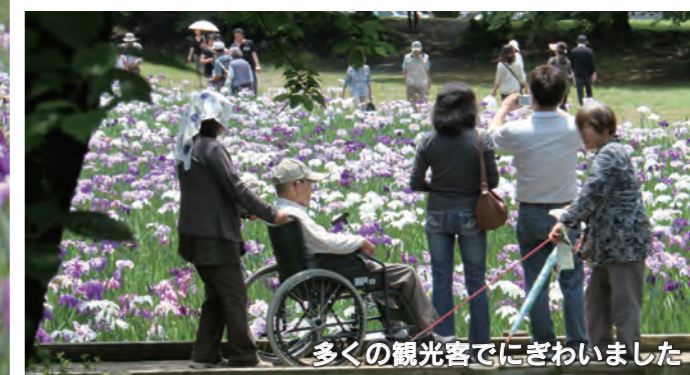
多くの観光客でにぎわいました

6月16日・17日の2日間、赤堀花しょうぶ園で「赤堀花しょうぶ園まつり2012」が開催されました。