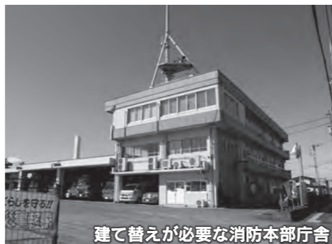
建て替えが必要な消防本部庁舎

●安全対策 これまで公共施設に自動体外式除細動器(AED)119台を設置してきました。市役所本庁舎内にAEDを追加して設置します。また、ポータブル型を4台配備し、うち3台は、各種行事での不測の事態に対応できるよう、貸し出し用とします。