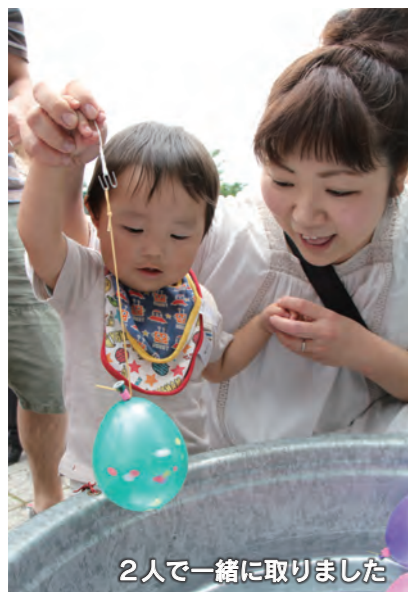
2人で一緒に取りました