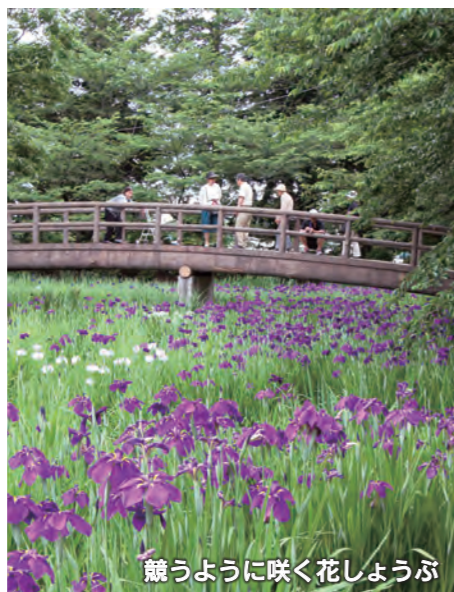
競うように咲く花しょうぶ