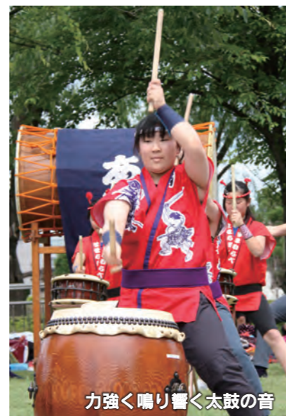
力強く鳴り響く太鼓の音