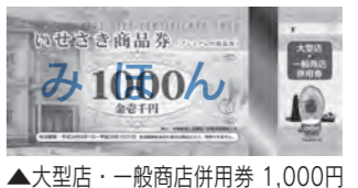
▲大型店・一般商店併用券 1,000円