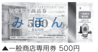
▲一般商店専用券 500円