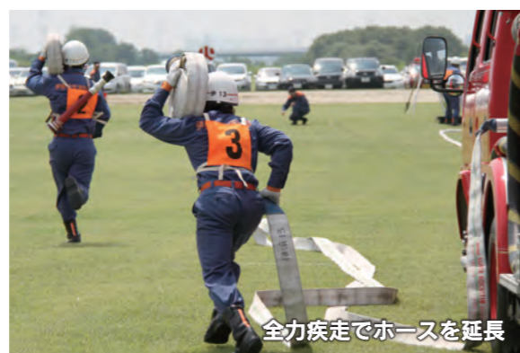
全力疾走でホースを延長

6月24日、八斗島ちびっこ広場で「消防ポンプ自動車操法大会」が開催され、伊勢崎市・玉村町の地域の予選を勝ち抜いた消防団10個分団が参加しました。この大会は防火水槽の水を使用し、前方の火点に見立てた標的を放水により倒し、その操作の正確性と時間を競う大会です。参加した分団は、日頃の訓練の成果を存分に発揮していました。