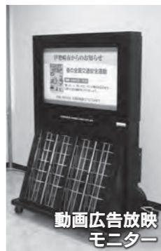
動画広告放映モニター

合場所に行政情報や動画広告を表示するディスプレイ(動画広告放映モニター)を設置し、職員の確保に努めています。