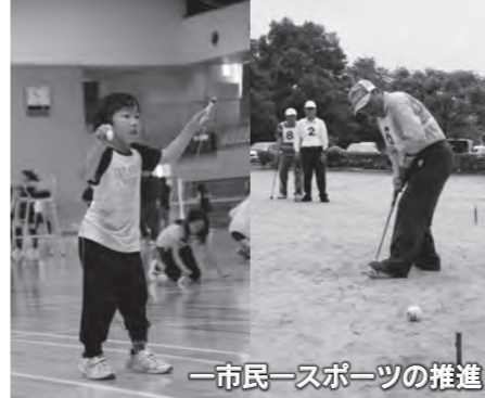
一市民一スポーツの推進