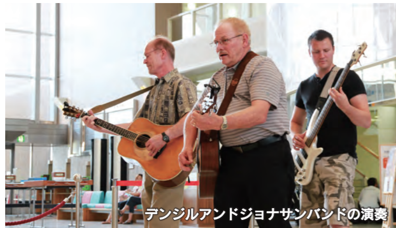
デンジルアンドジョナサンバンドの演奏