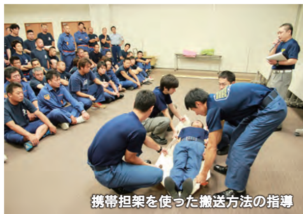
携帯担架を使った搬送方法の指導

8月20日・21日、市役所で消防団員を対象とした集団災害訓練が行われました。大きな事故や災害でたくさんの方が負傷した場合などに患者の治療に優先順位を付けるトリアージタグの説明や、負傷者の搬送方法の実技指導などを、消防本部の職員が行いました。参加した消防団員は、真剣な表情で訓練を受けていました。