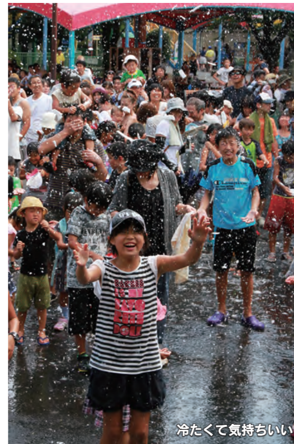
冷たくて気持ちいい