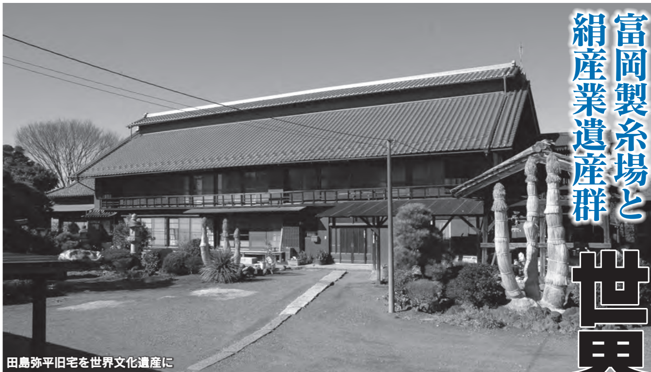
田島弥平旧宅を世界文化遺産に