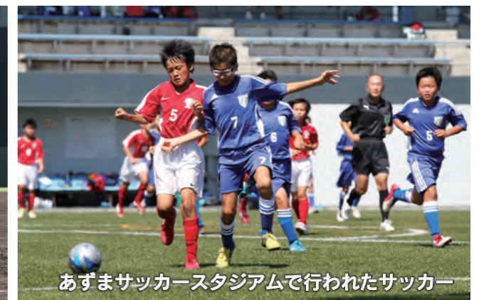
あずまサッカースタジアムで行われたサッカー

8月25日、あずまスタジアムなどで「青少年スポーツ交流大会」が開催され、野球とサッカーの2種目の競技が行われました。この大会は、本市・東京都台東区・新潟県長岡市寺泊地域の、三都市間のスポーツ交流推進のために毎年開催されています。台東区からは少年野球1チーム、寺泊地域からは少年野球、少年サッカーのそれぞれ1チームが参加。本市からは、野球には殖蓮ジュニアが、サッカーには殖蓮FC・佐波東サッカースポーツ少年団選抜の合同チームが参加し、各都市の代表チームと競技を通じて元気に交流を図りました。