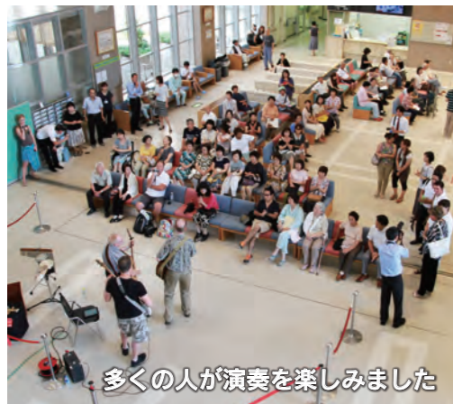
多くの方が演奏を楽しみました