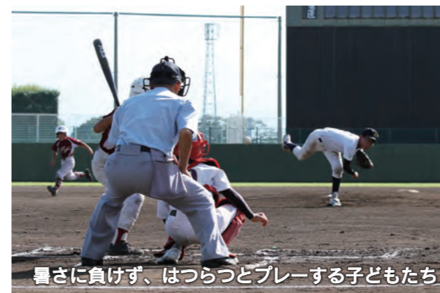
暑さに負けず、はつらつとプレーする子どもたち