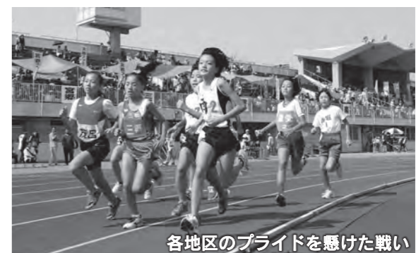
各地区のプライドを懸けた戦い

各地区を代表する選手が12競技16種目で地区対抗の熱い戦いを繰り広げます。 期日 10月7日(日) ※ソフトボールの1・2回戦、バレーボール男子、テニスは9月30日(日)午前9時から行います 時間 総合開会式 午前7時50分開始 ●競技 午前9時開始 ●種目・会場 左表のとおり 問い合わせ スポーツ振興課(☎27)2(7)4(7)