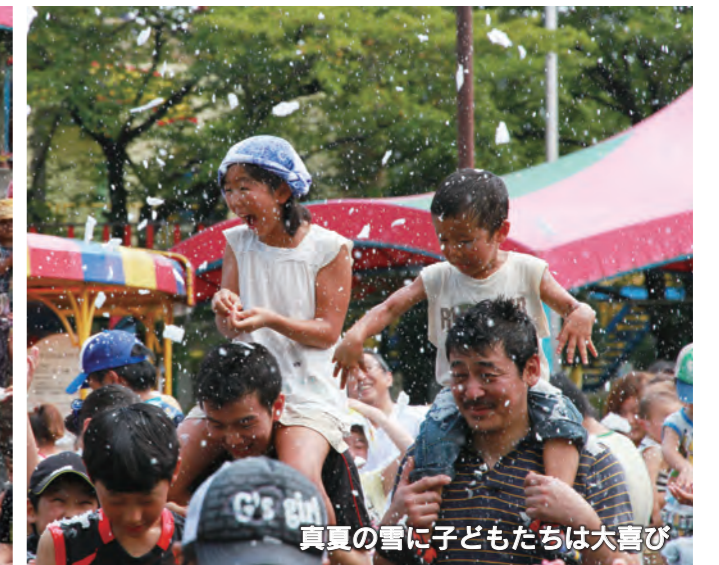
真夏の雪に子どもたちは大喜び

8月11日から16日までの6日間、華蔵寺公園遊園地で「真夏の雪の遊園地」が行われました。スノーマシンを使って、1回につき約150kgの氷の塊を3個、合計450kg分の氷を削って園内に人工雪を降らせるイベントで、家族連れなどたくさんの来場者が、涼を求めて集まりました。降雪ショーが始まると、集まったお客さんたちは歓声を上げながら、真夏の暑い遊園地に降る冷たい雪を楽しみました。