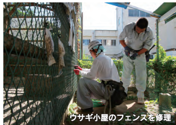
ウサギ小屋のフェンスを修理

8月21日、伊勢崎佐波職工組合と伊勢崎佐波高等職業訓練校の皆さんが、市内の幼稚園や小・中学校など、37の教育施設で老朽化した箇所の修理作業を行いました。三郷小学校では、ウサギ小屋のフェンスや体育館の基礎のひび割れなどの修理が行われ、職人の皆さんは真夏の太陽の下、一生懸命に作業をしていました。