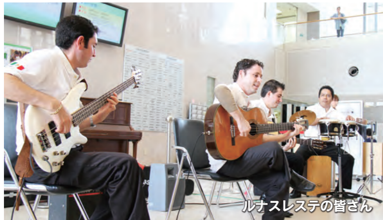
ルナスレステの皆さん

8月10日、いせさきまつり参加使節団によるコンサートが、市民病院1階ホールで開催されました。コンサートを行ったのは、いせさきまつりに参加するために来日した、姉妹都市・米国スプリングフィールド市のデンジルアンドジョナサンバンドと、スプリングフィールド市の姉妹都市であるメキシコ・トラケパケ市のバンド、ルナスレステの皆さん。2組のバンドの見事な演奏に、病院を訪れた人や患者さんなどから大きな拍手が送られました。