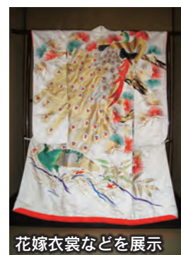
花嫁衣裳などを展示

昭和の花嫁御寮展 県内初の美容院として開業した村越美容院(本町)。明治時代から栄えた同店は、「村越で髪を結えば女が光る」と言われたほど、織物の街、伊勢崎の女性の憧れでした。現在はその役目を終え、昭和2年に建築された洋風建物は静かに姿を消そうとしています。店のにぎわいを知るであろう、当時の花嫁衣装や髪飾りなど、新春にふさわしい華やかな品々を展示します。ぜひ、ご覧ください。 期間 1月2日(水)から2月11日(祝)まで ※1月14日(祝)・2月11日(祝)を除く月・火曜日は休館です 時間 午前10時～午後5時 ※1月11日(金)は午後8時まで 会場・問い合わせ いせさき明治館(☎40-600850) 入場料 無料