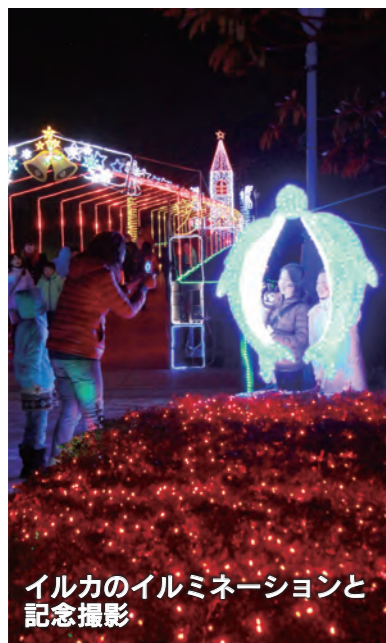
イルカのイルミネーションと記念撮影

12月1日から25日まで、波志江沼環境ふれあい公園で「いせさきイルミネーションナイト2012」が行われ、約80万個のLED電球で幻想的な雰囲気飾られた会場を、たくさんの方が楽しみました。本年はイルカやサンタクロースなどのイルミネーションが新たに仲間入り。夜の公園をいっそう華やかに盛り上げました。