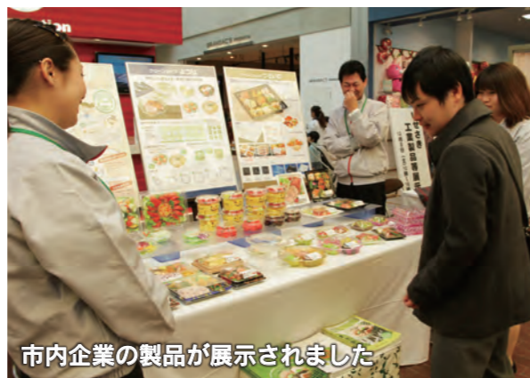
市内企業の製品が展示されました

12月8日、スマーク伊勢崎(西小保方町)を会場に、本市のものづくりを支える14企業が参加した「いせさき工業製品等展示会」が行われました。本市の製造業を応援するために開かれた展示会で、各ブースでは参加企業が自信の製品を展示・PRしました。訪れた人たちは興味深い様子で製品の説明を聞いていました。