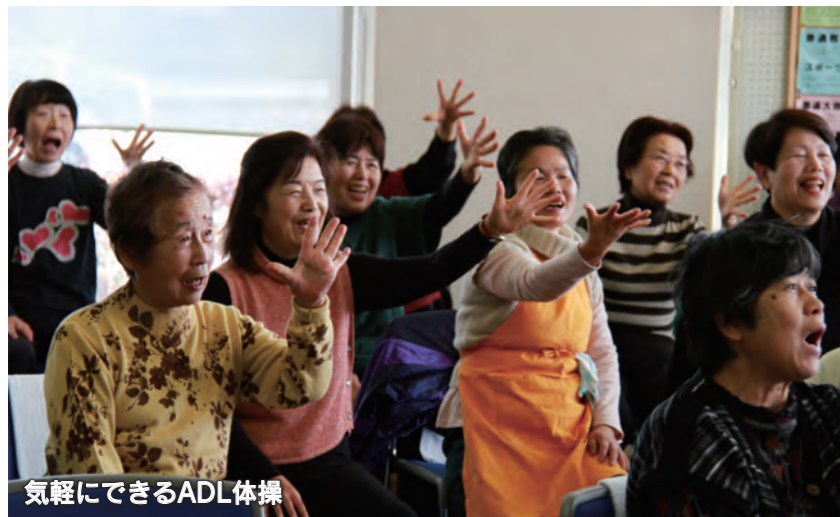
気軽にできるADL体操