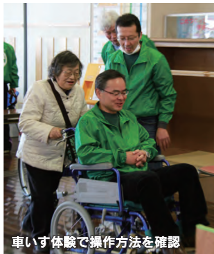
車いす体験で操作方法を確認