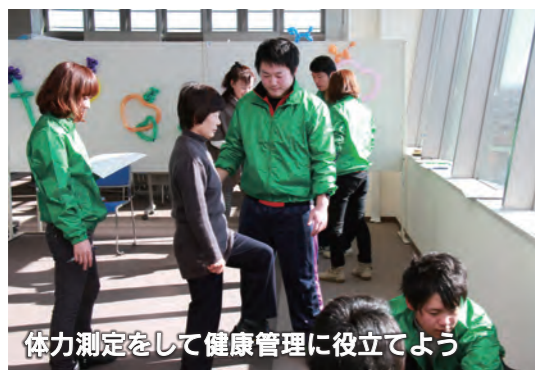
体力測定をして健康管理に役立てよう

11月25日、市役所で「介護予防フェスタ2012」が開催されました。介護が必要な状態になることを防ぐために、生活習慣を見直すことの大切さを知ってもらおうと、パネル展示や各種体験コーナーなど、さまざまな催しが行われました。