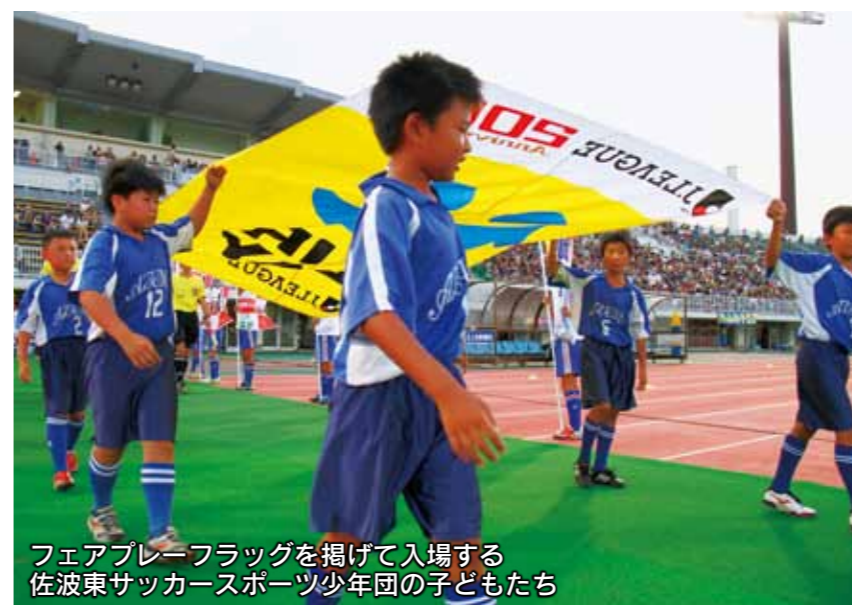
フェアプレーフラッグを掲げて入場する 佐佐東サッカースポーツ少年団の子どもたち

8月18日に正田 しょうゆ 醤油スタジアム群馬(前橋市)で行われたJ2第29節ザスパクサツ群馬対ロアッソ熊本の試合に、ザスパクサツ群馬が本市の皆さんを無料で招待しました。試合前にはお楽しみ抽選会や、フラダンスショーが行われました。また、ミスひまわりがいせさき花火大会など本市のPRをしました。