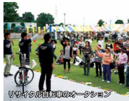
リサイクル自転車のオークション

のPRブース、フリーマーケット、新聞紙を使ったエコバッグ作り体験、うちエコ診断、環境クイズなどを行います。