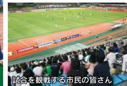
試合を観戦する市民の皆さん