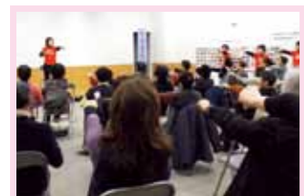
ADL体操は、日常生活動作の維持・向上を目的としたやさしい体操です。動きやすい服装で参加してください。