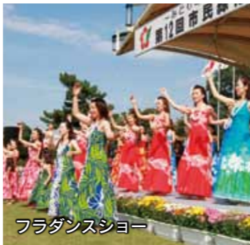
フラダンスショー