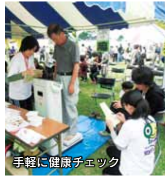
手軽に健康チェック

汗の広場のイベントコーナーで健康について楽しく学ぶことができます。簡単に健康チェックもできますので、この機会に自分や家族の健康を見直してみませんか。