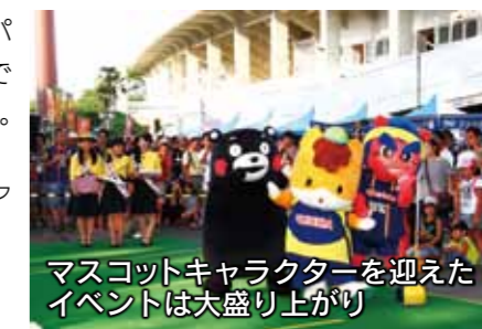
マスコットキャラクターを迎えた イベントは大盛り上がり