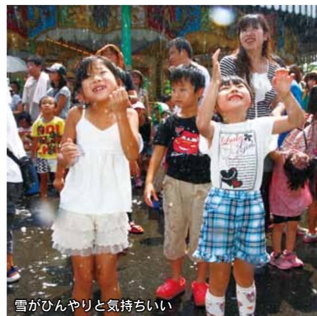
雪がひんやりと気持ちいい