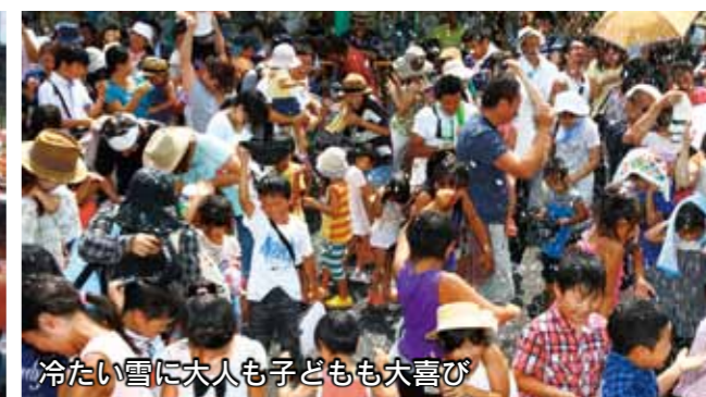
冷たい雪に大人も子どもも大喜び

8月13日から18日までの6日間、華蔵寺公園遊園地でスノーマシンを使って雪を降らせるイベント「真夏の雪の遊園地」が行われました。暑い日が続いていたこの期間、いつかの涼を求めて会場は多くの親子連れでにぎわいました。