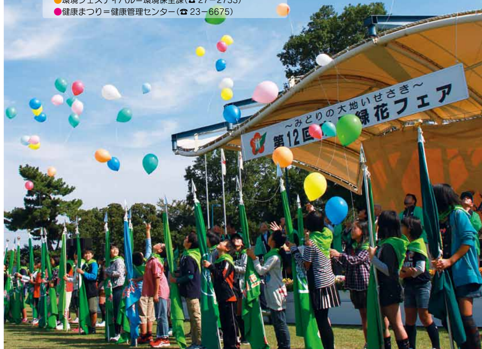
昨年のオープニングセレモニー