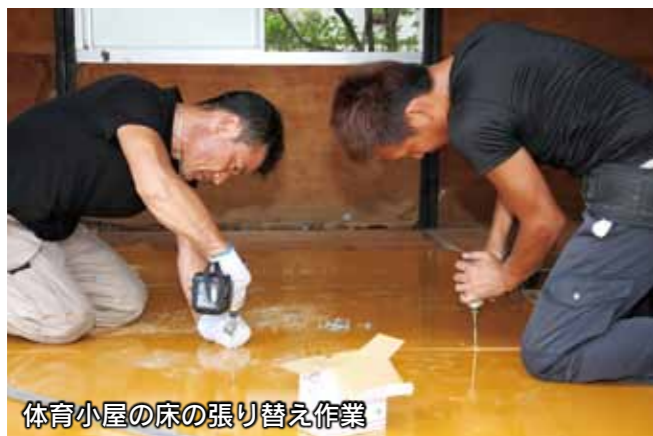
体育小屋の床の張り替え作業

8月22日、市内の幼稚園や小・中学校など34カ所の教育施設で、伊勢崎佐波職工組合の皆さんが、建物などの補修作業を行いました。