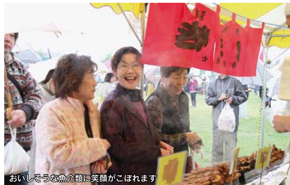
おいしそうな魚介類に笑顔がこぼれます