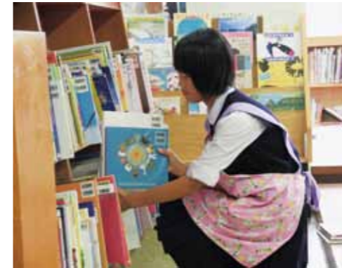
市水道局 水道設備の維持管理 伊勢崎市図書館 本の貸出・返却、 本の整理