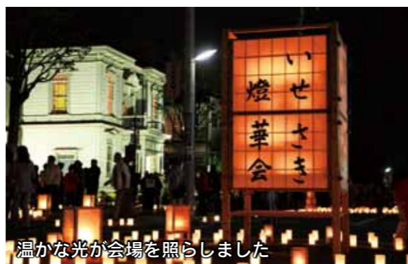
温かな光が会場を照らしました

10月19日・20日、いせさき明治館や赤石楽舎周辺で「いせさき燈華会」が開催されました。灯籠の点灯時刻になると、訪れた人とボランティアスタッフが一緒に約3,000本の灯籠に明かりをともしました。いせさき明治館と旧時報鐘楼もライトアップされ、訪れた人は普段と違った顔を見せる街並みを楽しみました。