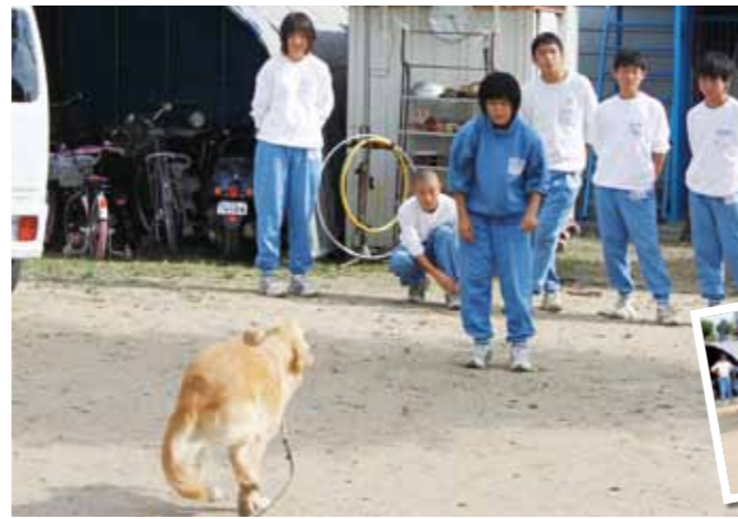
清水警察犬・家庭犬 訓練所 犬の訓練