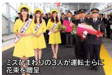
ミスひまわりの3人が運転士らに花束を贈呈