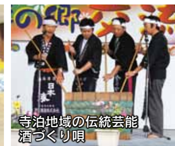
寺泊地域の伝統芸能 酒づくり唄