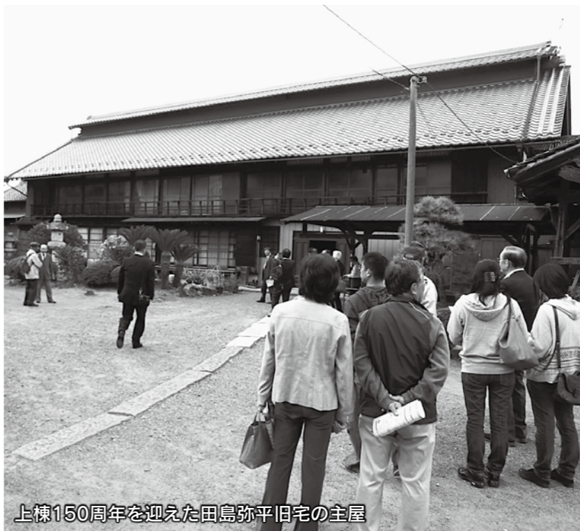
上棟150周年を迎えた田島弥平旧宅の主屋

期日 12月1日(日) 時間 午前10時～午後3時 駐車場 島村蚕のふるさと公園・境島小学校