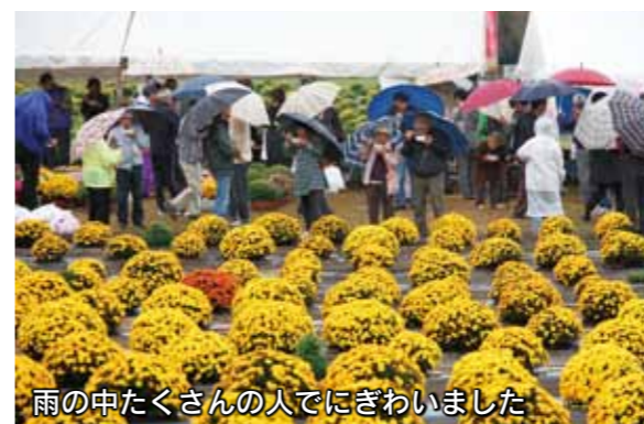
雨の中たくさんの人でにぎわいました

10月20日、「あかぼり小菊の里まつり」が同園(磯町)で開催されました。あいにくの雨模様でしたが、小菊の無料配布などもあり、たくさんの人でにぎわいました。会場で配られた温かい豚汁には長い行列ができ、肌寒い天気の中、おいしそうに頬張りながら小菊を観賞する人の姿が見られました。