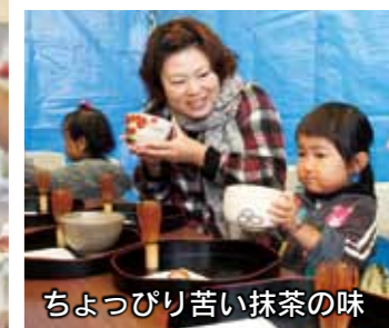
ちよっぴり苦い抹茶の味

10月20日、波志江沼環境ふれあい公園で「緋の郷交流まつり」が開催されました。国内友好親善都市の新潟県長岡市寺泊地域や近隣の市・町から参加した各種団体が、伝統芸能の披露や地元特産品の販売を行いました。また、世界各国の料理が楽しめる屋台などが会場を盛り上げました。この日は一日秋の雨が降り続き、行楽日和とはなりませんでした。訪れた人は埼玉県深谷市名物の煮ぼうとうで体を温めたり、雨にも負けず披露されたステージ発表に見入ったりしていました。