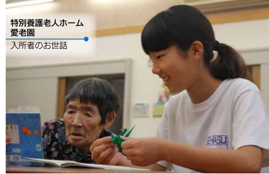
特別養護老人ホーム 愛老園 入所者のお世話