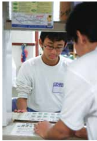
華蔵寺公園運動施設 管理事務所 施設の管理・利用の 受け付け