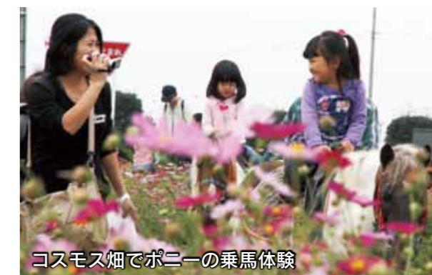
コスモス畑でポニーの乗馬体験

10月19日・20日、小泉稲荷大鳥居(小泉町)周辺で「コスモスまつり」が開催されました。小泉コスモス組合の皆さんが真心を込めて育てたコスモスを目当てに、大勢の人が訪れました。コスモスは自由に摘んで持ち帰ることもでき、訪れた人たちは思い思いの花束を作り、秋のひとつときを楽しみました。