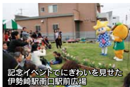
記念イベントでにぎわいを見せた伊勢崎駅南口駅前広場