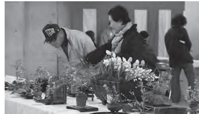
▲昨年の合同作品展の様子

ときめき俳句入門 期日 2月18日から3月18日までの火曜日(全5回) 時間 午前9時30分～11時30分 会場 茂呂公民館 対象 市内に在住または在勤・在学の人 定員 15人(先着順) 内容 俳句のやさしい歴史講座を受け、俳句を詠みます 参加料 無料 申し込み 2月10日(月)から直接または電話で茂呂公民館へ