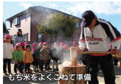
もち米をよくこねて準備

第三保育所では、地元、昭和町の地区役員と長寿会の皆さんの協力により、毎年1月に餅つき大会を行っています。1月10日、ことしも役員の皆さんが、朝早くから餅つきの準備をしてくれました。