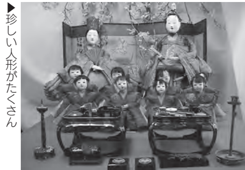
▶珍しい人形がたくさん

期間 2月21日(金)から3月12日(水)まで ※月曜日は休館です 時間 午前9時～午後5時 会場 赤堀歴史民俗資料館 内容 江戸時代の次郎左衛門雛や御所人形などの珍しいものや、雛人形・祢雛などを多数展示します 入場料 無料 問い合わせ 赤堀歴史民俗資料館(☎63-0030)