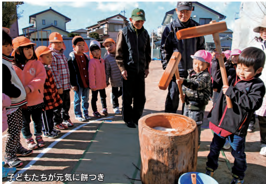
子どもたちが元気に餅つき