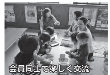
会員同士で楽しく交流

平成26年度の、児童センターおよび境児童センターの親子クラブ会員を募集します。各児童センターの行事やボランティア活動に参加して、親子で一緒に遊んだり、いろいろな物を作ったりしながら、会員同士で交流を深めてみませんか。 問い合わせ 児童センター ☎(23)6463 境児童センター ☎(70)6100