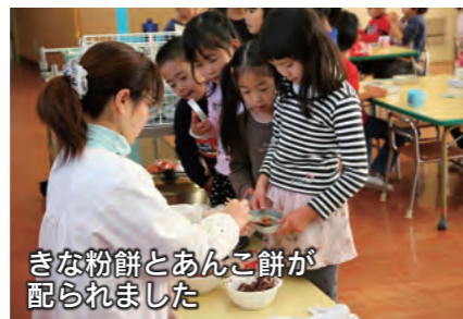
きな粉餅とあんこ餅が配られました