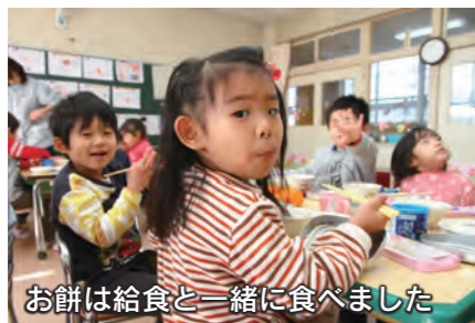
お餅は給食と一緒に食べました

つきたてのお餅は、役員の皆さんが小さく丸めて、きな粉餅やあんこ餅に。みんなでおいしくいただきました。