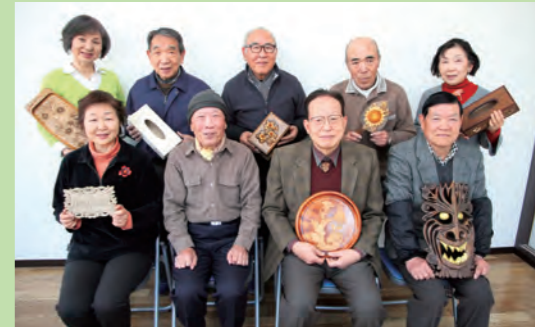
サークル名 茂呂木彫りの会