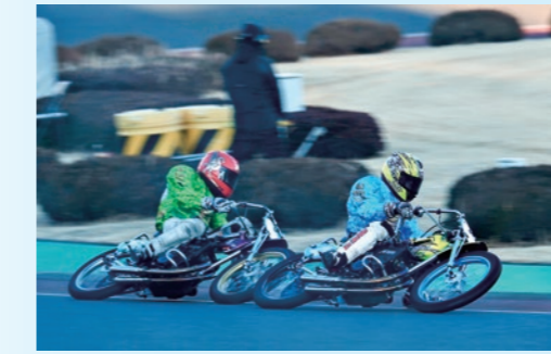
撮影場所：伊勢崎オートレース場

市広報プロモーション課公式Instagramで「#いち推し伊勢崎」を付けて投稿された皆さんの写真を紹介しています。