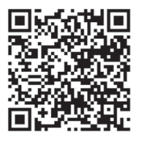
▲市ホームページはこちら

申請には、申請書、工事内容が分かる見積書・図面・写真・施工業者の確認書類などが必要で、詳しくは問い合わせください。 ※助成金申請書の提出は、住宅リフォーム窓口(市役所本館5階)からダウンロードできます。 申請書は、申請書、工事内容が分かる見積書・図面・写真・施工業者の確認書類などが必要で、詳しくは問い合わせください。 ※助成金申請書の提出は、住宅リフォーム窓口(市役所本館5階)からダウンロードできます。