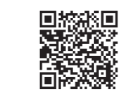
◀臨時特別給付金の詳細はこちら