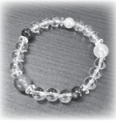
▲自分好みのブレスレットを作ろう