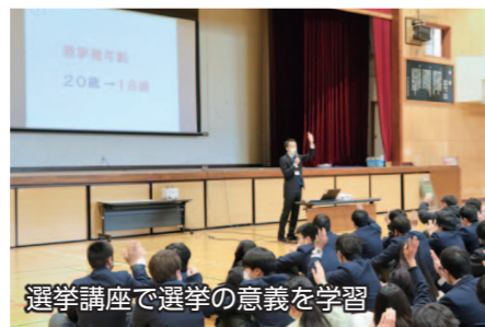
選挙講座で選挙の意義を学習

12月14日、伊勢崎工業高等学校で2年生の生徒を対象に「選挙出前授業」が行われました。授業では、選挙講座と模擬選挙が行われ、選挙の意義や仕組みを学習。模擬選挙では、実際の選挙で使用される投票箱などを使い、受付や投票、開票を体験しました。