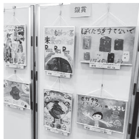
▲令和元年度の3R促進ポスターコンクール入賞作品展示

会場 伊勢崎駅前インフォメーションセンター 内容 3R促進ポスターコンクール入賞作品の展示、リユース食器や生ごみ処理器の展示、環境関連DVDの放映、節電や省エネについての啓発など 入場料 無料