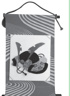
▲かぶとの壁飾りをつくってみませんか

期日 2月22日・3月1日・8日の火曜日(全3回) 時間 午後1時～3時30分 会場 あずま公民館 対象 市内に在住の人 定員 10人(先着順) 内容 帯やひもを使って、かぶとの壁飾りを作ります 参加料 2,500円(材料費) 申し込み・問い合わせ 1月24日(月)午前9時から参加料を添えてあずま公民館(☎62-0115)