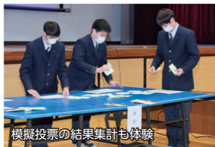
模擬投票の結果集計も体験