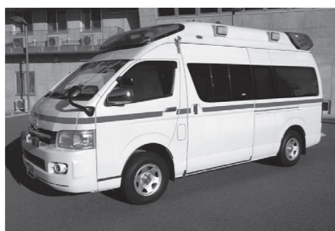
▲公売する高規格救急自動車

高規格救急自動車などを「KSI官公庁オークション」で公売します。参加申し込みや入札は「KSI官公庁オークション」のホームページ( hitps://kankoch.jp/ )から受け付けます。