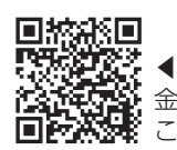
◀拡充給付金の詳細はこちら