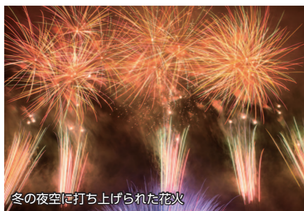
冬の夜空に打ち上げられた花火

12月11日、伊勢崎オートレース場で新型コロナウイルス感染症の収束を願い、「おうちで楽しむ! いせさき冬花火」が行われました。本市ゆかりのロックバンド「LACCO TOWER」の楽曲に合わせて打ち上げられた花火は約2,000発。その様子はYouTubeで生配信され、迫力のある映像を届けました。