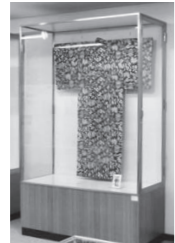
▲伊勢崎銘仙を展示します