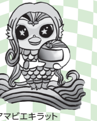
アマビエキラット