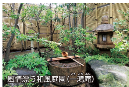
風情漂う和風庭園(一鴻庵)