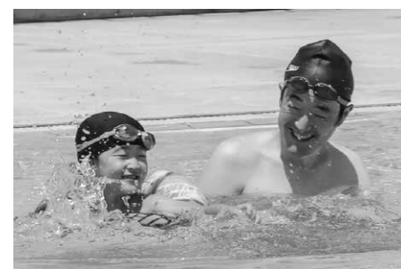
▲プールで遊び夏の思い出をつくりませんか

屋外プールがオープンします 期間 7月9日(土)から8月31日(水)まで ※天気や水温などにより休場・閉鎖する場合があります ※新型コロナウイルス感染症の拡大防止のために利用を制限する場合があります 問い合わせ スポーツ振興課(☎27-2747) 【境プール】 時間 午前10時～午後5時 入場料 一般 220円、高校生以下 100円 ※市内に在住の65歳以上の人と未就学児は無料 問い合わせ 境プール(☎74-4774) ※オープン前はあずまウォータールランド(☎62-9966)に問い合わせてください 【あずまウォータールランド】 7月9日(土)から8月31日(水)までは、利用時間が変わります。 ※火曜日と8月7日(日)は休館です 時間 ● 平日 午前10時～午後9時 ● 屋外プールは午後5時まで ● 土・日・祝日 午前10時～午後5時