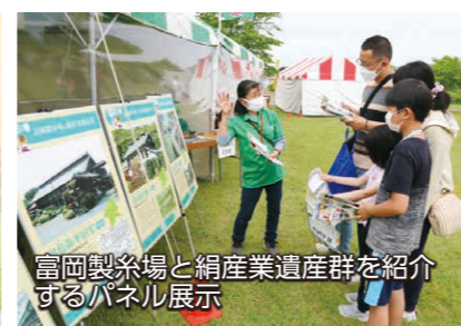
富岡製糸場と絹産業遺産群を紹介するパネル展示