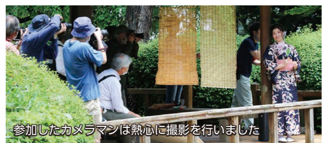
参加したカメラマンは熱心に撮影を行いました

5月14日、華蔵寺公園で「ミスひまわり写真撮影会」が行われました。ミスひまわりは、伊勢崎銘仙の着物姿や爽やかな洋服姿で登場。園内の観覧車や木々などを背景にモデルを務めました。会場には、150人のカメラマンが集結し、華やかな笑顔で応じるミスひまわりの最高の瞬間をカメラに収めようと、熱心に撮影していました。