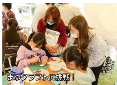
まゆクラフトに挑戦!

5月15日、利根川水辺プラザ公園で「島村渡船フェスタ」が開催されました。「ふれあい・協調」をテーマにした、移動水族館や創作・遊び体験などのイベントが盛りだくさん。ステージでは、獅子舞などの郷土芸能やダンスショーなども行われ、多くの人で盛り上がりました。