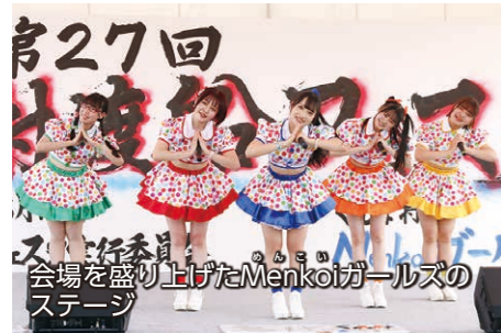
第27回 会場を盛り上げたMenkotaiガールズのステージ