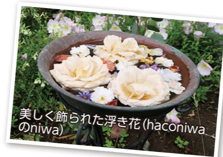
美しく飾られた浮き花(haconiwaのniwa)

4・5月の各2日間、市内各所で花や緑で彩られた自宅の庭を公開する「オープンガーデンいせさき」が行われました。5月には24カ所の庭が公開され、美しく咲きそろった花々が多くの人を出迎えました。庭主の手入れが行き届いた庭には見どころが満載。心を込めて育てられた草花が、見学に訪れた人たちを楽しませました。