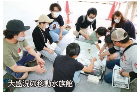
大盛況の移動水族館