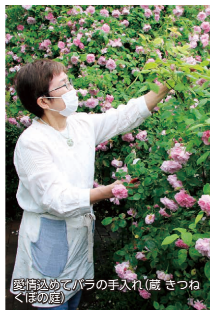
愛情込めてバラの手入れ(蔵きつねくほの庭)