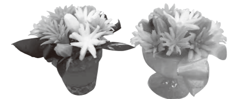
▲ソーパークーピングのフラワーアレンジメント

期日 7月12日(火) 時間 午前10時~正午 会場 北公民館 対象 市内に在住または在勤の人 定員 10人(先着順) 内容 セっけんを飾り彫りし、優しく香るフラワーアレンジメントを作ります 参加料 500円(材料費) 申し込み・問い合わせ 6月28日(火)午前9時から電話で北公民館(☎25-4547)