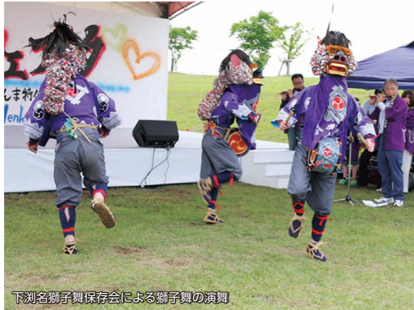
下渚名獅子舞保存会による獅子舞の演舞

5月15日、利根川水辺プラザ公園で「島村渡船フェスタ」が開催されました。「ふれあい・協調」をテーマにした、移動水族館や創作・遊び体験などのイベントが盛りだくさん。ステージでは、獅子舞などの郷土芸能やダンスショーなども行われ、多くの人で盛り上がりました。