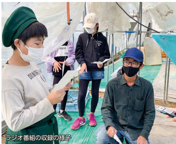
ラジオ番組の収録の様子