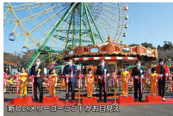
新しいメリーゴーランドがお目見え

2月4日、Auto Mirai華蔵寺遊園地（華蔵寺公園遊園地）のメリーゴーランドがリニューアルオープンしました。新しいメリーゴーランドは、赤や金を基調とした華やかなデザインときらびやかなイルミネーションが特徴。この日はメリーゴーランドが無料開放され、訪れた人は新しいメリーゴーランドに乗って楽しんでいました。