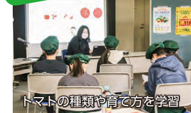
トマトの種類や育て方を学習