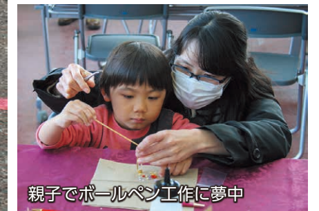
親子でボールペン工作に夢中