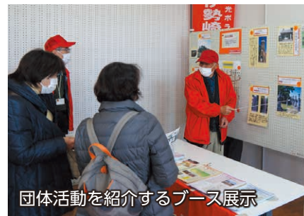
団体活動を紹介するブース展示

2月5日、緋の郷で「市民ボランティアフェスティバル」が開催されました。市内で活動するボランティア団体や市民活動団体が、ステージ発表や活動体験、ブース展示などを通してそれぞれの活動を紹介。会場には多くの方が訪れ、参加団体の皆さんと楽しく交流していました。