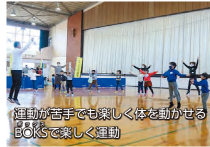
運動が苦手でも楽しく体を動かせるBOKSで楽しく運動