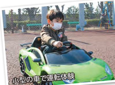
小型の車で運転体験

2月4日、伊勢崎オートレース場で「Thanks Oval Fes」が開催されました。走路改修記念イベントとして、普段は入ることのできない伊勢崎オートレース場の走路を一般開放。会場では、ジョギング大会や走路をキャンパスにした落書きイベントなどさまざまな催しが行われ、来場者は開放感のある広い走路で思い思いにイベントを楽しみました。