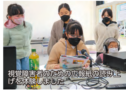
視覚障害者のための広報紙の読み上げを体験しました