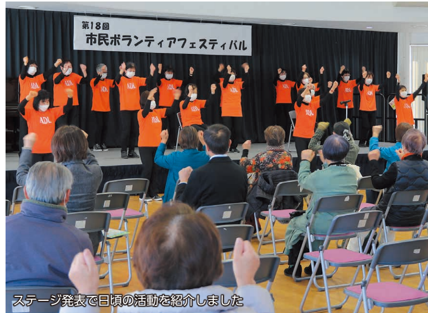
ステージ発表で日頃の活動を紹介しました