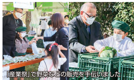
「産業祭」で野菜などの販売を手伝いました

ラジオ番組「JA暮らしナビ」に出演し、農家の畑さんやJA全農ぐんまの職員などにインタビューをして、ミニトマトの種類や育て方のコツなどを周知しました。また「産業祭」や「農業まつり」などのイベントに参加して野菜や加工食品の販売の手伝いをしました。