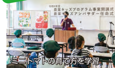
ミニトマトの育て方を学習