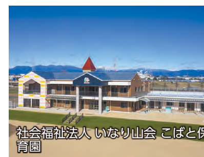
社会福祉法人 いなり山会 こぼと保育園