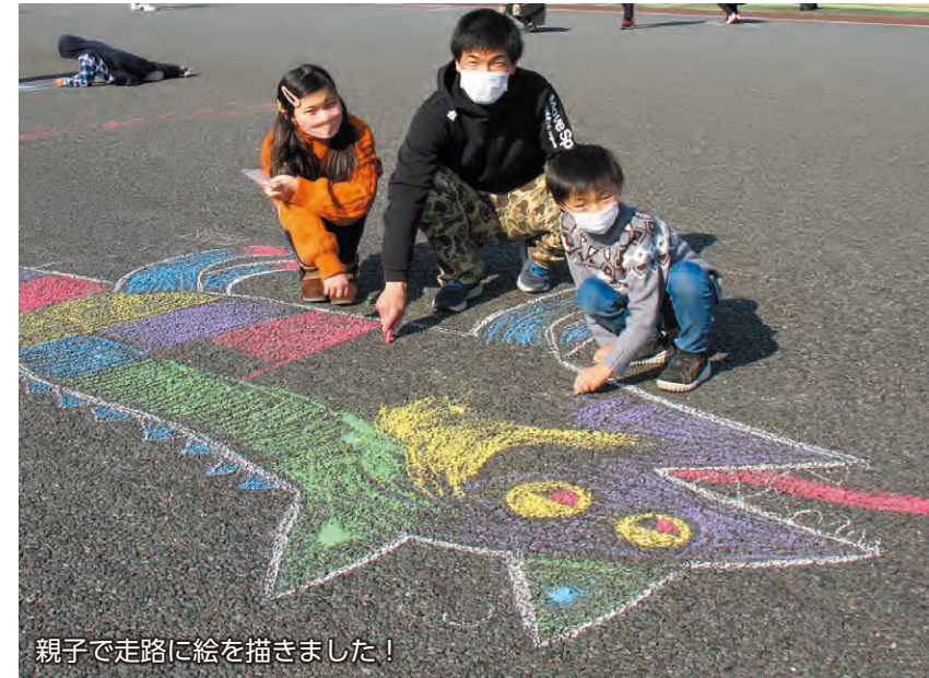
親子で走路に絵を描きました！