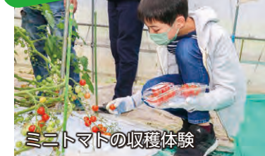
ミニトマトの収穫体験