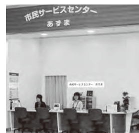
▲仕事帰りや買い物の際に利用できます

市内2カ所の市民サービスセンターでは戸籍や住民票、所得証明書などの発行や、現年度分の納税(納付書が必要)ができます。午前10時から午後7時まで業務を行っており、年末年始を除き、土・日・祝日も利用できます。気軽に利用してください。