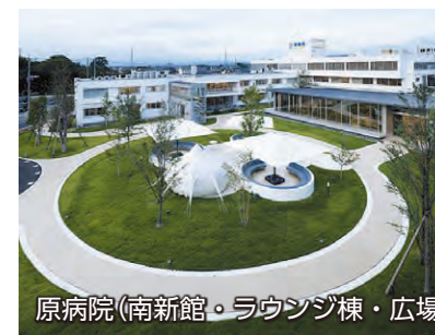
原病院（南新館・ラウンジ棟・広場）