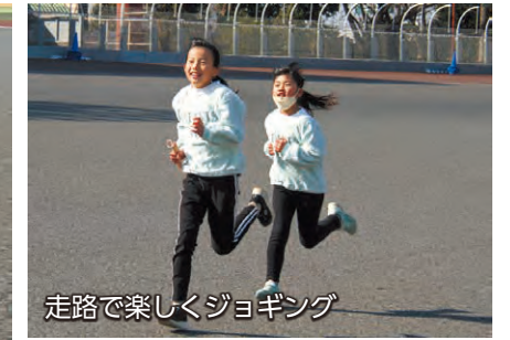
走路で楽しくジョギング