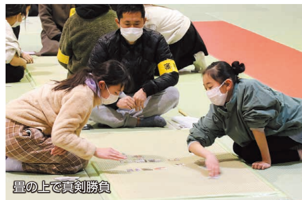
畳の上で真剣勝負

1月29日、ナルセグループ伊勢崎市民プラザで「市上毛かるた競技大会」が開催され、各地区の代表に選ばれた子どもたちが個人戦・団体戦で対戦しました。真剣な表情で、対戦相手と向き合う子どもたち。張り詰めた空気の中、札を読む声が会場に響くと、子どもたちはその声に合わせて、素早く札に手を伸ばしました。