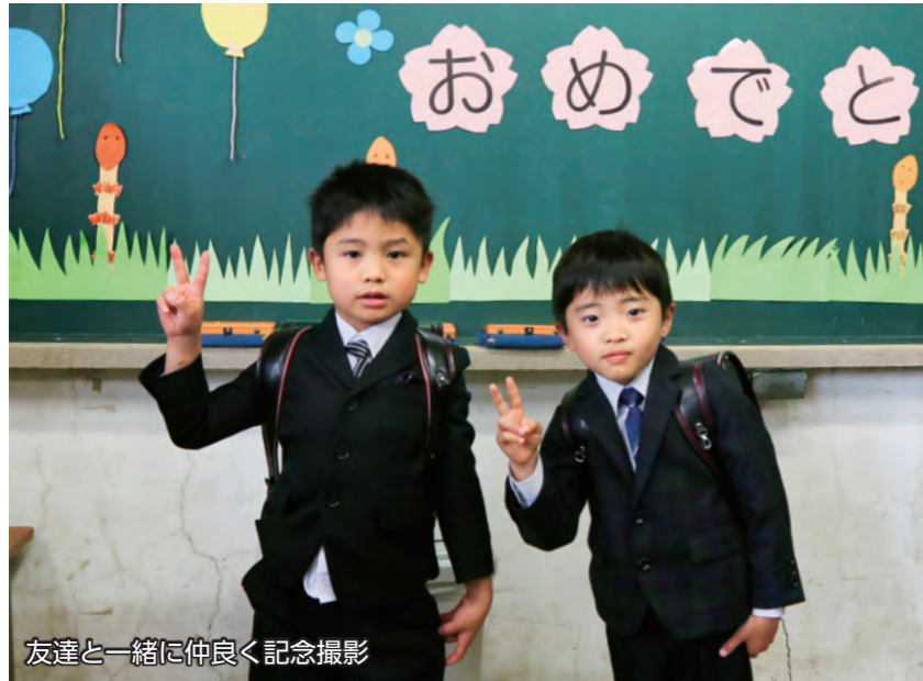
友達と一緒に仲良く記念撮影