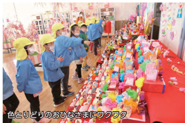
色とりどりのおひなさまにワクワク

2月17日から3月21日まで、伊勢崎駅前インフォメーションセンターで「春の賑わい まちなか華フェスタ」が行われました。開催初日には第一幼稚園の園児たちが会場を訪れ、自分たちが作った作品を見学しました。園児たちは、会場内を歩き回りながら自分や友達が作った作品を探し、見学を楽しんでいました。