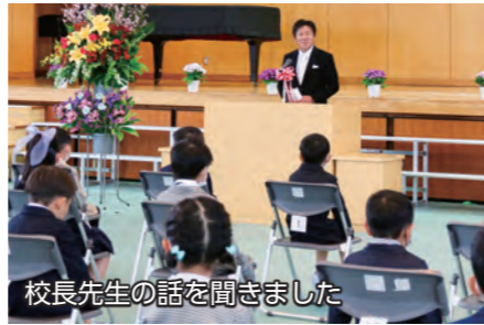
校長先生の話を楽しみました

4月7日、市内の小学校23校で入学式が行われ、1,640人の新1年生が誕生しました。