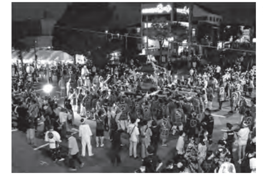
◀2022年度グランプリ作品 ライマックス