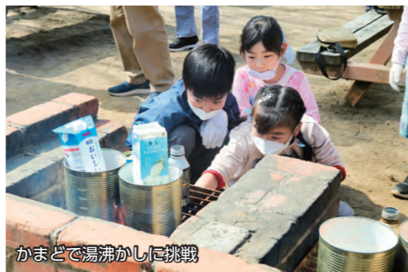
かまどで湯沸かしに挑戦

3月11日、まゆドームで「防災を学ぼう」教室が行われました。参加した子どもたちは、防災グッズの作り方や総合防災マップを見ながら災害発生時の命の守り方などを学びました。学習後は、屋外に移動してかまどで火をおこし、お湯を沸かして非常食のアルファ化米を試食。楽しみながら防災を学ぶ子どもたちの姿が見られました。