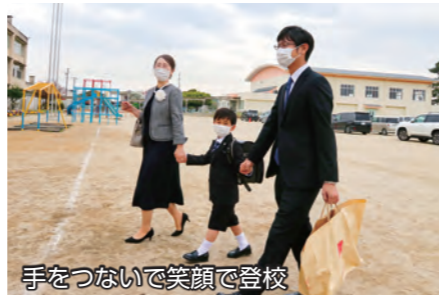
手をつないで笑顔で登校