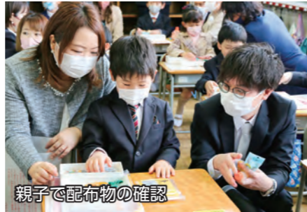
親子で配布物の確認