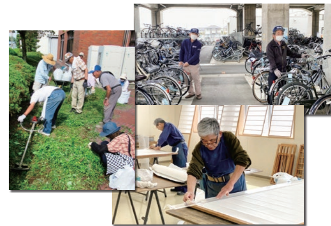
▲老人クラブ・シルバー人材センターの活動の様子

高齢者が生き生きと活躍できる社会の実現の重要性について、市民の理解を深めるため、広報活動や啓発活動を行います。