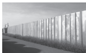
▲一定規模以上の塀の建設などにも届け出が必要です

期日 6月26日・7月3日・10日の月曜日(全3回) 時間 午前10時～11時30分 会場 茂呂公民館 対象 市内に在住の1歳3カ月以上3歳未満の子どもとその保護者