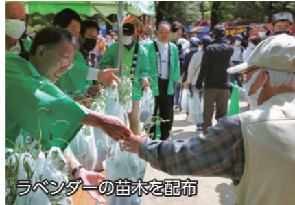
ラベンダーの苗木を配布

5月3日、華蔵寺公園で「グリーンフェスタ2023」が開催されました。緑あふれる園内で、来場者はワンコイン寄せ植え教室や苗木の配布など緑と花に触れ合うイベントを楽しみました。ステージではフラダンスショーや子どもたちによる和太鼓演奏などが行われ、多くの人たちを魅了しました。