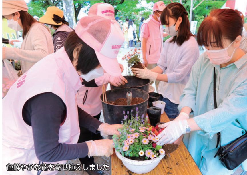
色鮮やかな花を寄せ植えました

5月3日、華蔵寺公園で「グリーンフェスタ2023」が開催されました。緑あふれる園内で、来場者はワンコイン寄せ植え教室や苗木の配布など緑と花に触れ合うイベントを楽しみました。ステージではフラダンスショーや子どもたちによる和太鼓演奏などが行われ、多くの人たちを魅了しました。