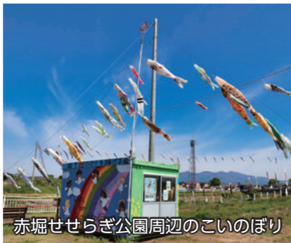
赤堀せせらぎ公園周辺のこいのぼり