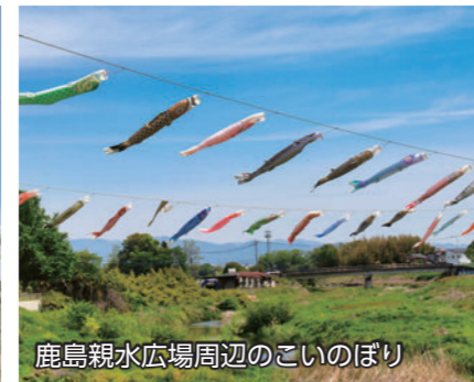
鹿島親水広場周辺のこいのぼり

4月上旬から5月中旬にかけて、赤堀せせらぎ公園周辺で約500匹、鹿島親水広場周辺で約150匹のこいのぼりが揚げられました。青空を気持ち良さそうに泳ぐ、色とりどりのこいのぼり。粕川沿いでは、堤防の上を散歩しながらこいのぼりを眺める人の姿が見られました。