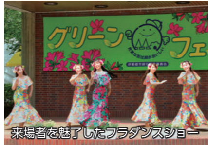
来場者を魅了したフラダンスショー