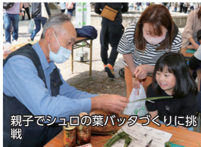
親子でシュロの葉バッタづくりに挑戦