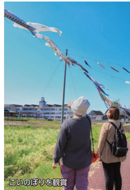
こいのぼりを観賞

4月上旬から5月中旬にかけて、赤堀せせらぎ公園周辺で約500匹、鹿島親水広場周辺で約150匹のこいのぼりが揚げられました。青空を気持ち良さそうに泳ぐ、色とりどりのこいのぼり。粕川沿いでは、堤防の上を散歩しながらこいのぼりを眺める人の姿が見られました。