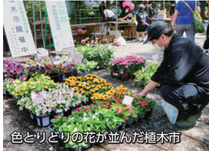
色とりどりの花が並んだ植木市