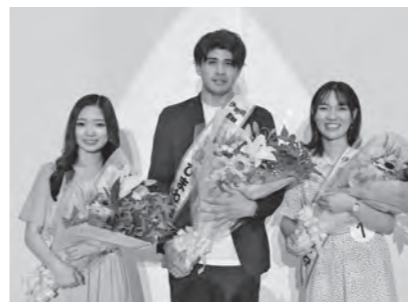
▲昨年のコンテストで選ばれた第36代ひまわりの3人

問い合わせ 伊勢崎商工会議所青年部(☎24)2211)または市観光物産協会(文化観光課内、☎27)2759)