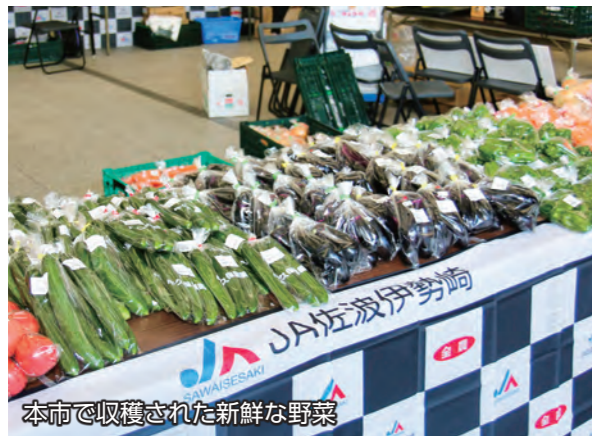
本市で収穫された新鮮な野菜