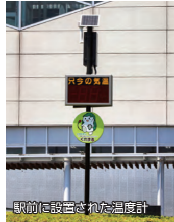
駅前に設置された温度計

6月20日から伊勢崎駅南口駅前広場でミスト装置の運用を開始しました。昨年の夏は、最高気温が40度を超えるなど、近年の記録的な猛暑を受け、市民の熱中症対策の一環として、全長約190メートルのミスト装置と温度計1台を設置しました。夏の間、通勤や通学、さまざまなイベントなどで駅前広場を訪れる人の暑さを和らげてくれます。