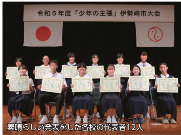
素晴らしい発表をした各校の代表者12人

6月29日、あずまホールで「少年の主張」伊勢崎市大会が行われました。大会には、市内の中学校と四ツ葉学園中等教育学校から各校の代表者12人が参加。代表者はそれぞれ、努力することの素晴らしさ、物事を前向きに考えることの大切さなど、日々の暮らしの中で抱いたさまざまな思いを発表しました。