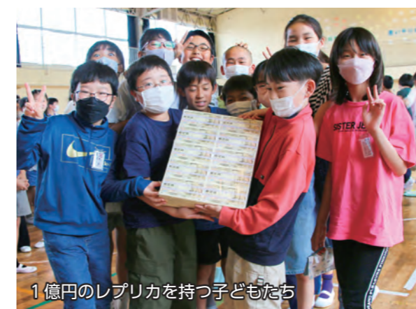
1億円のレプリカを持つ子どもたち