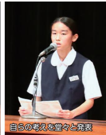
自らの考えを堂々と発表