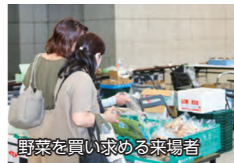
野菜を買い求める来場者