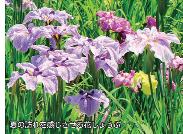
夏の訪れを感じさせる花しょうぶ

6月7日、赤堀花しょうぶ園では見頃を迎えた花しょうぶが見頃を迎えました。国指定史跡「女堀」の遺構に咲いた約2万5,000株の花しょうぶが来場者を歓迎。訪れた人たちは、一面に広がる花しょうぶを觀賞したり、写真に収めたりして、園内の美しい風景を楽しんでいました。