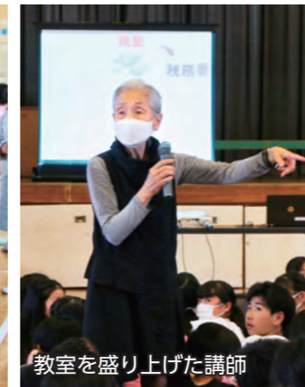
教室を盛り上げた講師

6月9日、三郷小学校で6年生を対象とした「租税教室」が行われました。教室では、税金がどのように使われているかなど、税金の種類や役割を動画視聴などを通して学習。教室の最後には、1億円のレプリカを持って重さを実感する子どもたちの姿が見られました。