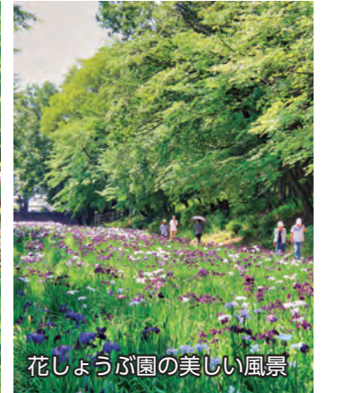
花しょうぶ園の美しい風景