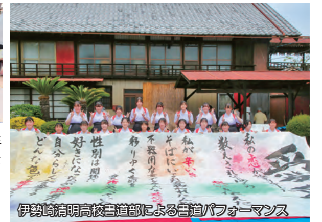
伊勢崎清明高校書道部による書道パフォーマンス