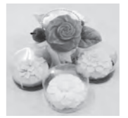
▲教室で作る作品例

定員 10人(先着順) 内容 セツけんを切り彫りし、ジュエルフラワーを作ります 参加料 3000円(材料費) 申し込み 8月8日(火)午前9時から電話で北公民館へ